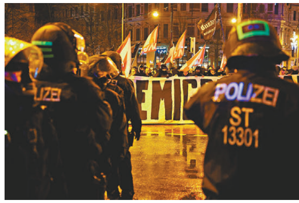
●馬格德堡約千人示威抗議，高呼支持極右和反移民口號。

案發後馬格德堡大教堂舉行悼念活動，教堂在晚上7時04分，即遇襲一刻敲響鐘聲。總理朔爾茨等亦有出席，他希望全國團結一致，不要被仇恨分化，並下令徹查事件。約1,000人到市中心示威抗議，高呼支持極右和反移民口號，有人與警員推撞，亦有示威者被扣留。