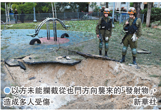
●以方未能攔截從也門方向襲來的「發射物」，造成多人受傷。

當天較早時，胡塞武裝承認對以色列特拉維夫雅法地區的「軍事目標」實施了導彈打擊。此前以軍發布消息說，以方當天未能攔截一枚從也門方向襲來的「發射物」，據報該「發射物」落在特拉維夫，造成多人受傷。