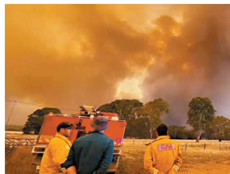
●澳洲維多利亞州山火肆虐，逾600名消防員參與撲救。