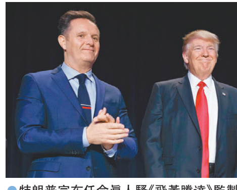
●特朗普宣布任命真人騷《飛黃騰達》監製伯內特(左)出任新設的英國特使。

《衛報》指出，特朗普迅速任命大使，負責在海外宣揚他的「美國優先」政策，最近一周更先後任命5名大使，但不少人選均缺乏外交資歷，有資深外交政策分析師形容有關任命，是對其派駐國家的「蓄意侮辱」，部分人選更與派駐國家有業務聯繫，存在利益衝突風險。