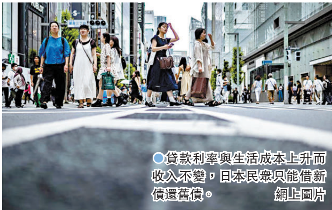
●貸款利率與生活成本上升而收入不變，日本民眾只能借新債還舊債。

一些大型經濟體中，民眾的借貸均有所增加，但日本相對較低的工資，使這問題特別嚴重。根據經濟合作與發展組織(OECD)的數據，去年日本的平均薪金約為4.7萬美元(約36.5萬港元)，遠遠落後於美國的約8萬美元(約62.1萬港元)，「一些公司的工資仍然很低，無法追上物價上漲的步伐。」