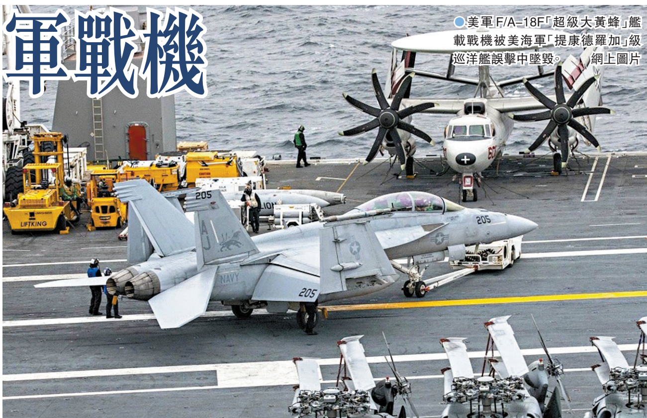
●美軍F/A-18F「超級大黃蜂」艦載戰機被美海軍「提康德羅加」級巡洋艦誤擊中墜毀。網上圖片

此前美軍曾斥巨資升級「葛底斯堡號」。美國政府問責辦公室(GAO)早前發布審計結果稱，美國海軍已花費近37億美元(約287.6億港元)用於升級7艘「提康德羅加」級巡洋艦，然而在花了這麼多錢後，卻沒有得到結果，7艘巡洋艦中僅完成了兩艘，分