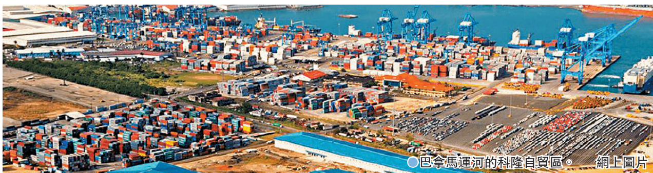
●巴拿馬運河的科隆自貿區。網上圖片

1989年，時任美國總統老布什以所謂「保護運河、推翻獨裁者」為由出兵巴拿馬。多個拉丁美洲國家強烈反對，質疑美國設法推翻條約、拒絕歸還運河。在國際社會壓力下，美國與巴拿馬於1995年簽訂協議，保證運河永久中立，美國最終如期於1999年12月31日，將運河正式移交巴拿馬政府。