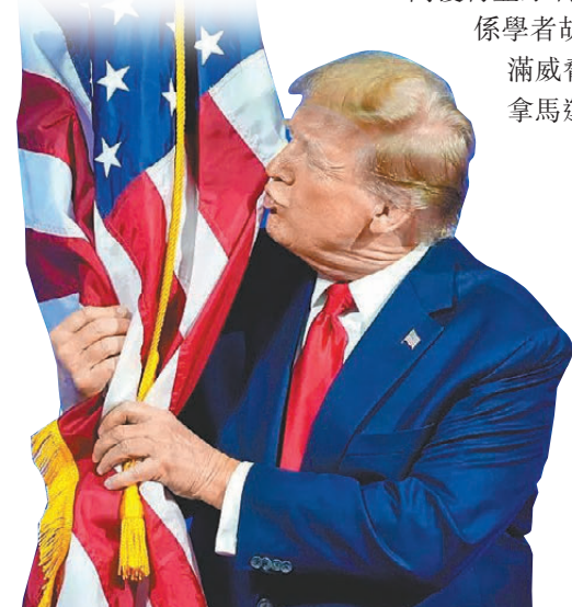
●特朗普誇大美工人死亡數字。

香港文匯報訊 美國總統當選人特朗普上週六(12月21日)忽然宣稱，位於中美洲的巴拿馬運河是「美國重要國家資產」，批評巴拿馬運河對美國海軍和商船徵收高額通行費用，還錯誤暗指巴拿馬運河所謂「由中國管理」。特朗普威脅巴方需降低收費，否則美國將「收回」巴拿馬運河。巴拿馬學者痛批特朗普的言論荒謬至極，是美國試圖威脅打壓他國換取自身利益的最新例證。