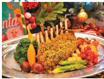
●黑蒜香草焗新西蘭羊排