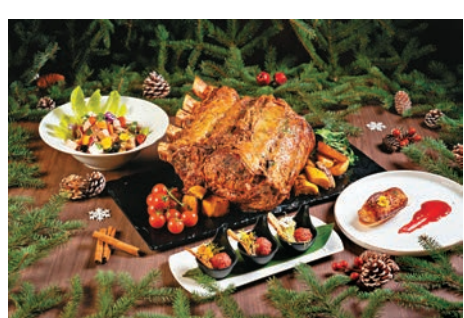
●希臘火雞沙律、燒牛肉、香煎鵝肝配紅桑子茸、丹麥式牛肉韃靼

酒店的節慶饗樂體驗，由廚師團隊精心預備琳瑯滿目的美食佳節，包括咖啡廳及茶園豐富自助餐、Grand Hyatt Steakhouse 君悅扒房和 Grissini 意大利餐廳的浪漫晚餐，以及 The Grill 露天池畔餐廳的優質燒烤自助晚餐，以充滿節慶感的美饌為你譜出難忘滋味。