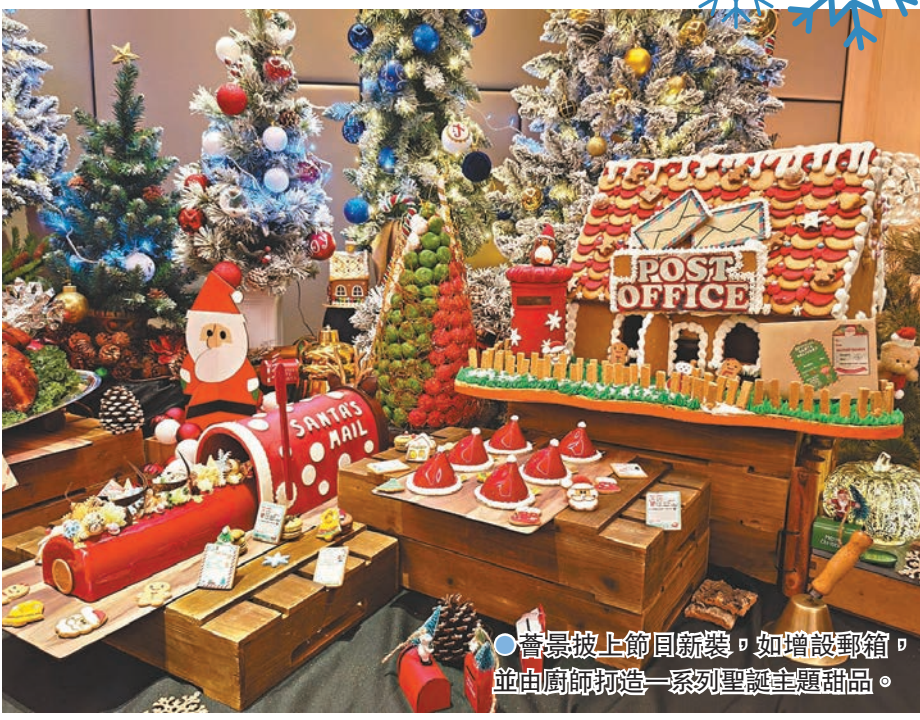
●晉景披上節日新裝，如增設郵箱，並由廚師打造一系列聖誕主題甜品。

輪流供應的多款烤肉菜式是佳節自助餐的另一亮點推介，即點即切，保留原汁原味。例如，於除夕自助午餐及晚餐供應的燒威靈頓牛柳、於節日自助午餐及晚餐供應的燒特級牛肉，還有節慶經典聖誕燒火雞，以低溫慢燉來保