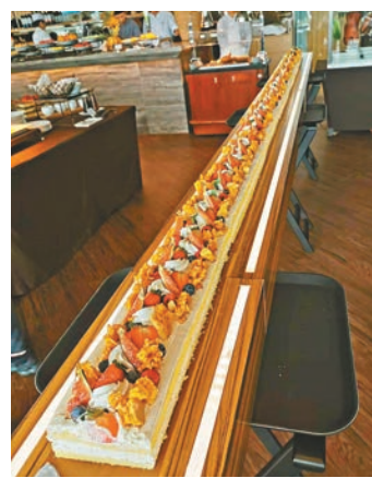
●長達18呎的巨型鮮果蛋糕