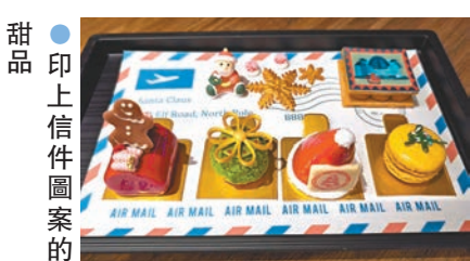
●印上信件圖案的甜品