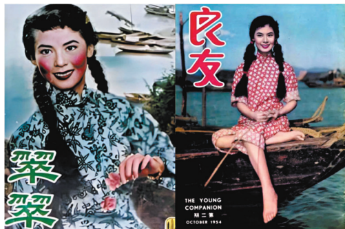
林黛部處女作《翠翠》，裏頭個look可以講得「由頭靚到落腳趾公」！有咁嘅條件，第日唔紅都有天理喇！