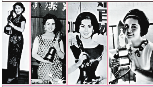
22歲就做亞洲影后；24歲攝多屋；26、27仲「採莊」（輝聯）；林黛認真誇咁！ 《金蓮花》一人分飾兩角；《貂蟬》度做古裝； 《千嬌百媚》大跳特跳；《不了情》同你談悲情； 四屆亞洲影后林黛，絕對唔係浪得虛名！