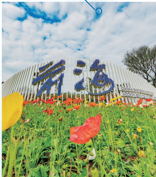
《前海規劃》出台，為深港合作按下加速鍵。

此外，「前海港澳e站通」提供從政策諮詢、系統申報到營業執照領取等企業開辦「一站式」全流程服務，實現「足不出港」開辦前海企業，開通以來，重點圍繞企業開辦這一核心需求，面向港澳企業和居民提供包含「註冊易」「辦稅易」「社保通」等368項政務服務，其中前海政務服務172項，商事登記服務36項，涉稅服務125項，社保服務23項，智慧財產權（商標）9項、專利1項，公積金2項。前海還啟動「出海e站通」全面賦能企業出海。不久前，深圳（前海）國際資料產業園啟動成立，着眼國際資料合作、企業集聚發展、產業生態培育等基礎配套服務，全面支撐前海「資料特區」建設。