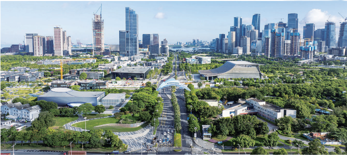
櫛次鱗比的高樓勾勒出嶄新的城市天際線，前海從一片灘涂成為發展的熱土。

值《前海規劃》出台一周年，前海全面加快打造全面深化改革創新試驗平台、高水平對外開放門戶樞紐、深港深度融合發展引領區、現代服務業高質量發展高地，呈現更加生機勃勃發展態勢。一組數據可以直觀地反映前海的「活力」：今年前三季度，前海地區生產總值實現1,864億元（人民幣，下同），增長8.2%；在地進出口實現5,212.8億元，增長50.1%；跨境電商進出口實現971.8億元，增長189.1%；實際使用外資121.7億元，佔深圳48.2%。