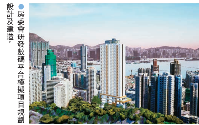
房委會研發數碼平台模擬項目規劃及建造。

香港文匯報訊 由房委會自主研發的一站式數碼管理平台「智築目」獲得「2024香港資訊及通訊科技獎」銀獎，提供一個虛擬平台，模擬項目規劃、設計、建造及交付整個