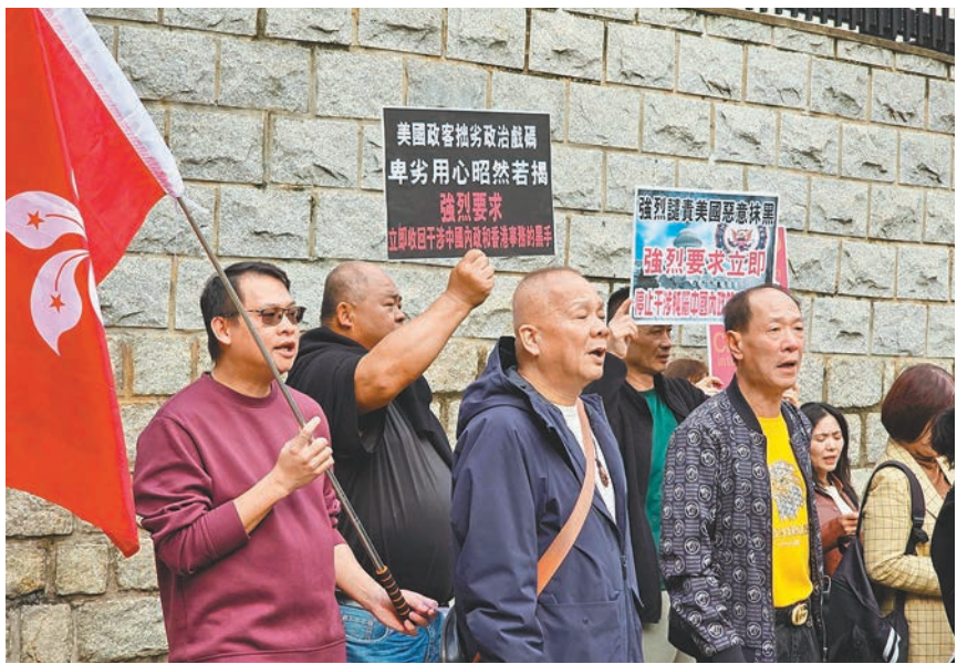
●市民日前到美國駐港領館外請願，譴責外國勢力干預港司法。

香港文匯報訊 美國國會日前通過2025財政年度的《國防授權法案》，當中包括重新納入《香港人權與民主法案》的「制裁」條款。昨日，香港特區政府表示強烈不滿和堅決反對，指美國公然叫囂提出所謂的「制裁」，以期恫嚇履職盡責的香港特區人員，「其拙劣政治戲碼和卑劣用心昭然若揭，特區政府予以強烈譴責。」又強調香港特區對所謂「制裁」嗤之以鼻，無懼要挾，堅定不移履行維護國家安全的責任。