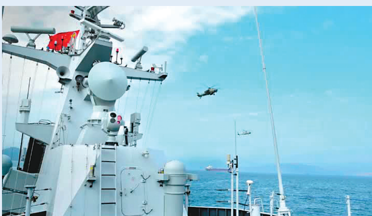
●聯合巡邏涵蓋陸上高機動步兵、海上戰訓艦艇、空中巡邏直升機等多個兵種。