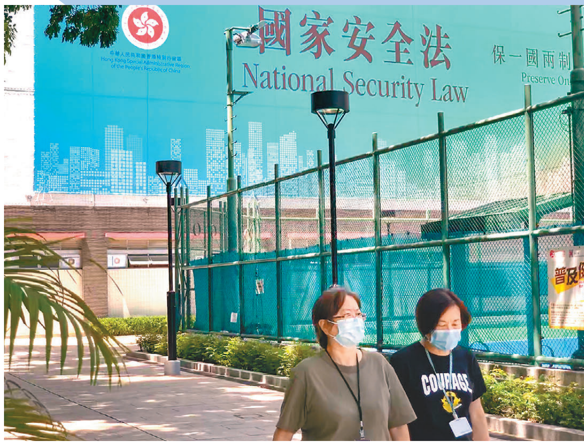
●特區政府發言人表示，香港國安法和《維護國家安全條例》只針對極少數人，不會影響香港居民依法享有的基本權利和自由。圖為國安法宣傳板。資料圖片

發言人重申，特區政府一直全面及嚴格執行聯合國安理會所施加的制裁，以履行國際義務。「我們通過有效的機制執行聯合國安理會的決議，包括拒絕聯合國安理會指定及可疑的船隻進入香港；監察和巡查可疑的香港公司，防止其參與規避聯合國制裁的活動。同時，特區政府一直實施一套全面及嚴謹有效的戰略物品出口管制制度，以及通過中央人民政府積極參與《化學武器公約》及《武器貿易條約》。我們的工作成效一直獲得各貿易夥伴的尊重和認同並一向備受國際認可。」