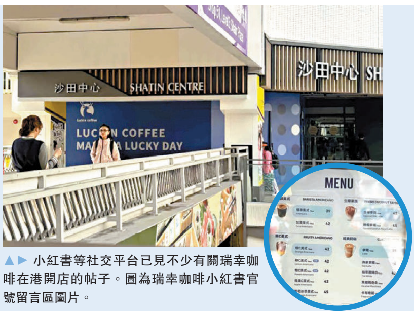
▲▲ 小紅書等社交平台已見不少有關瑞幸咖啡在港開店的帖子。圖為瑞幸咖啡小紅書官號留言區圖片。

早前就有網友在社交媒體發布香港門店的價目表，顯示瑞幸的「標準美式(Americano)」及「拿鐵(Latte)」定價為39元，招牌產品「生椰拿鐵」42元。見到香港的價單後，網友紛紛對這一定價表示「失望」，稱未能迎來「平民咖啡」，港版瑞幸咖啡價格似乎未能體現親民策略，與本地多個連鎖咖啡品牌的價格相比沒有太多優勢。