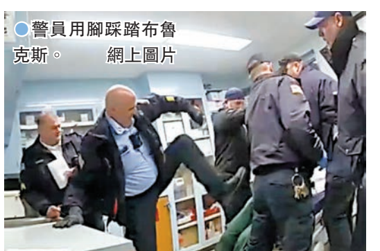
●警員用腳踩踏布魯克斯。

紐約州懲戒協會2022年訪問馬西監獄記錄顯示,該監獄41%囚犯是非裔,另有21%拉丁裔囚犯,91%的工作人員都是白人。被關押的約800名囚犯中,約80%都表示曾目睹或經歷過員工虐待囚犯事件,近70%囚犯表示監獄內存在種族歧視。