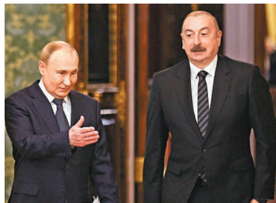
●普京(左)與阿利耶夫通電話,討論空難相關問題。

一架從阿塞拜疆巴庫飛往俄羅斯格羅茲尼的客機周三在哈薩克斯坦西部城市阿克套近郊墜毀。機上共有62名乘客、5名機組人員,其中38人喪生。