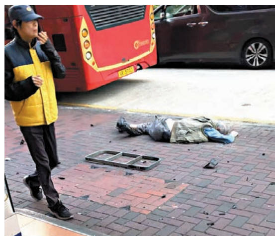
●68歲途人被私家車撞倒捲車底拖行，重傷昏迷，送院後證實不治。