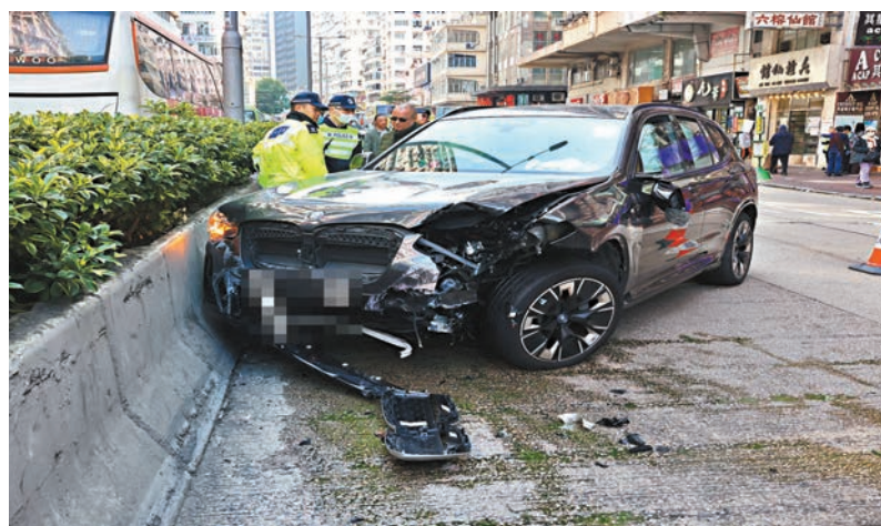
●肇事寶馬私家車剷上行人路，再反彈馬路撞倒石壘停下，警員到場調查。