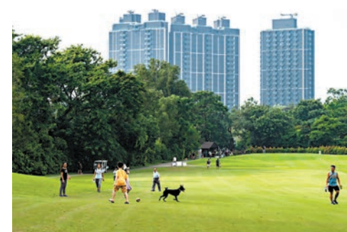
●環保署及土木工程拓展署決定就粉嶺高爾夫球場環評報告的司法覆核提出上訴。資料圖片

另外，發展局發言人表示，土木工程拓展署(土拓署)作為此司法覆核的利害關係方已就判決向上訴庭提出上訴。發言人指出，有關問題涉及《環評條例》的合法和合理詮釋，不但關乎擬議球場建屋項目的環評報告，亦廣泛影響其他發展項目的環評工作，影響深遠，政府有必要按箇中