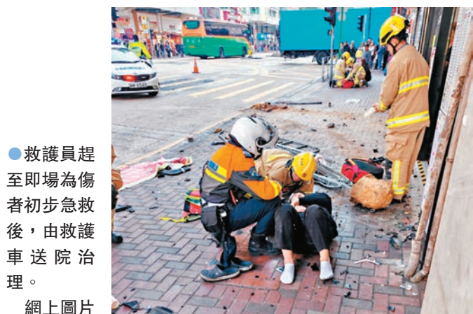
●救護員趕至即場為傷者初步急救後，由救護車送院治理。