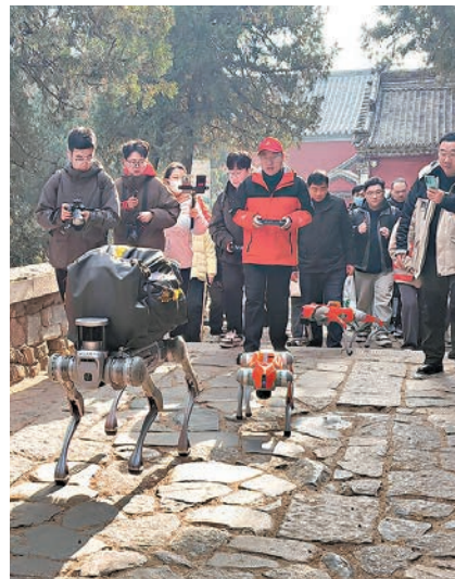
升級版，B2-W機器狗就是把B2的足端改成了輪子，這樣它的通過性、續航性都得以提升。」宇樹科技市場經理孫寶岩告訴記者，輪子的速度太快，B2機器狗更適合景區這樣的低速場景。本次在泰山的測試將持續三個月。

此次測試恰逢泰山的寒冷冬季，氣溫波動劇烈，最低氣溫已降至零下5度，且泰山石階上出現了寒霧與結冰現象。對於機器狗B2來說，這一環境無疑是一項嚴峻的考驗。測試結果顯示，機器狗B2在低溫環境下依舊表現出色，能夠順利完成各種環衛任務。其優異的穩定性和強大的續航能力確保了B2能夠在四季變換、氣候