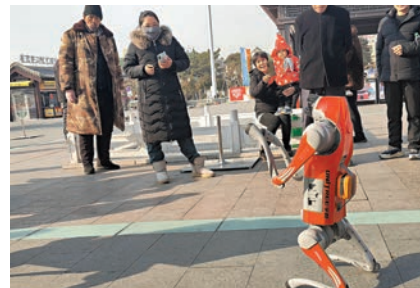
▲宇樹科技消費級機器狗Go2和遊客互動。

此次測試恰逢泰山的寒冷冬季，氣溫波動劇烈，最低氣溫已降至零下5度，且泰山石階上出現了寒霧與結冰現象。對於機器狗B2來說，這一環境無疑是一項嚴峻的考驗。測試結果顯示，機器狗B2在低溫環境下依舊表現出色，能夠順利完成各種環衛任務。其優異的穩定性和強大的續航能力確保了B2能夠在四季變換、氣候