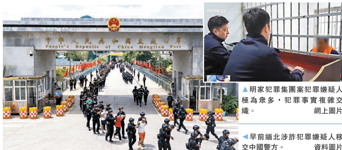
▲明家犯罪集團案犯罪嫌疑極為眾多，犯罪事實複雜交織。