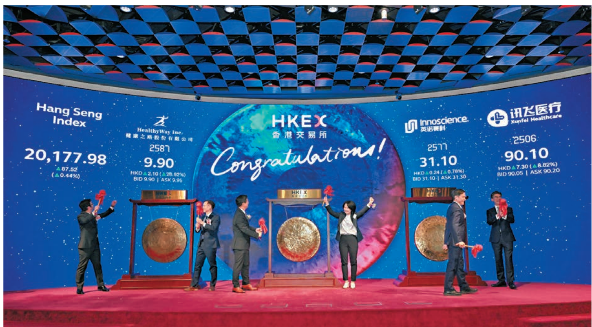
●訊飛醫療、英諾賽科(蘇州)及健康之路三隻新股昨日在香港交易所上市。

香港文匯報訊（記者 周紹基）港股市昨日觀望氣氛濃厚，大市持續「炒股不炒市」。恒指先升後跌，全日跌49點報20,041點，守住二萬點關口及50天線(20,040點)之上，惟成交額縮減至近1,286億元。昨日有三隻新股於港交所首日掛牌，包括訊飛醫療(2506)、英諾賽科(蘇州)(2577)及健康之路(2587)，其中訊飛醫療是數碼港社群企業特選第三批重點企業夥伴，該股全日收報87元，較上市價82.8元高5.1%，每手賬面賺210元。數碼港行政總裁鄭松岩表示，很榮幸見證今年落戶數碼港的訊飛醫療在港上市，這不僅體現了數碼港社群企業的創科實力，更印證了香港作為內地企業「走出去」的跳板角色，肯定香港作為「超級聯繫人」及「超級增值人」的獨特優勢。