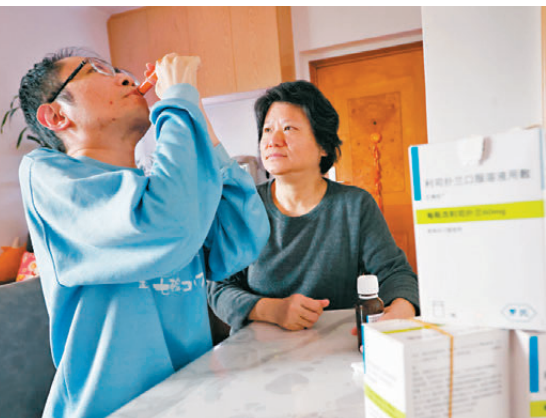
●以霖北上求醫獲處方口服藥後情況好轉，黎太太亦感高興。