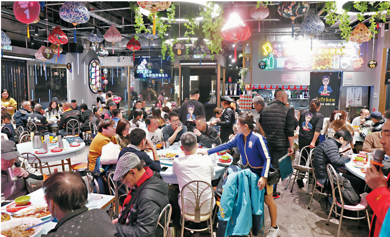
●朱敏記晚市旺場，食客滿足口福之餘，還玩得過癮。