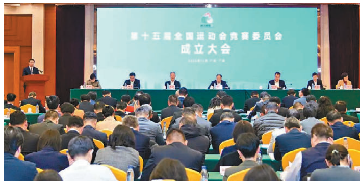
●十五運競委會成立。

香港文匯報訊（記者 敖敏輝 廣州報導）2024年12月31日，中華人民共和國第十五屆運動會競賽委員會成立大會在廣州舉行，國家體育總局領導及相關負責人員、十五運會組委會領導及相關負責人員、各項目競賽委員會負責人等出席會議，香港賽區、澳門賽區分別派出代表參加。這也意味着，十五運會籌備工作從基礎準備階段轉向以競賽為中心的實施階段。根據安排，十五運會廣東賽區共設立52個項目競委會，覆蓋廣東省十五個承辦地級以上城市。為做好各項工作，國家