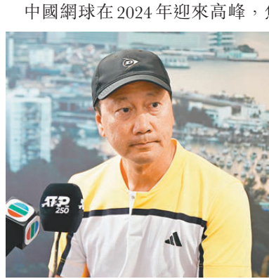
●張德培昨日在記者會上表示，維園是舉辦網球賽的好地方。

張德培又表示香港網球「一哥」黃澤林能夠成為小球迷的榜樣：「黃澤林也在鼓勵其他的香港後起之秀，周日我與一班年輕球手交流，看見香港網球有所進步，他們水平非常之好。」他續指很高興看見黃澤林對網球保持熱情：「黃澤林很期待參與香港公開賽，情況就像小孩子來到糖果店一樣開心。」