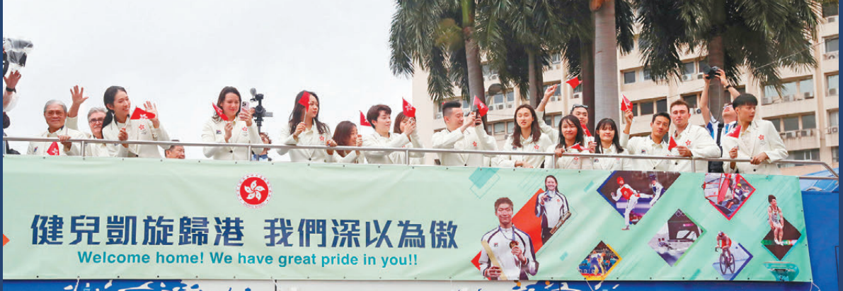
●未來一年港隊運動員將有更多展現實力的機會。資料圖片