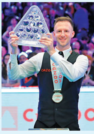
●卓林普將以香港居民身份亮相啟德體育園。資料圖片

啟德體育園將於今年首季正式啟用，世界格蘭披治桌球大獎賽將在3月4日至9日於啟德體育園上演。這是香港35年來首次承辦桌球排名賽，由於場地可容納超過4,000人，這個比賽有望成為歷來最多觀眾的桌球排名賽。 大獎賽是球員系列賽的開幕戰，只限球季最頂尖的32名球手參加。當中最矚目的可說是兩名先後經優才計劃獲得香港居民身份的奧蘇利雲和卓林普。現時世界排名第一的英國球星卓林普，成為繼去年10月底的七屆世界冠軍奧蘇利雲後，另一名透過該計劃成為香港居民的桌球名將。 綽號「準神」的卓林普表示將3月在啟德體育園上演的世界大獎賽，視為他在香港履行推廣桌球運動使命的首個機會。世界桌球大獎賽會是他成為香港人後首次出戰世界賽，相信獲不少主場球迷支持。他早前接受訪問時指出，移居香港其中一個目標是令桌球在香港「愈做愈大」，又稱有意在港開設桌球會，讓更多香港新一代接觸到這項運動，見證下一位港產世界冠軍誕生。兩名球星成為「新香港人」對本地桌壇發展裨益良多，不僅有助提升這項運動的關注度，更有機會成為桌球保留體院A級精英資格的「籌碼」。