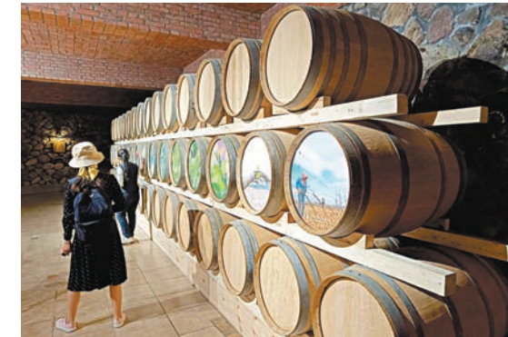
●遊客在儲酒罐留名。