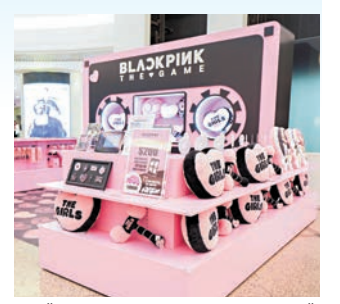
●《BLACKPINK THE GAME》期間限定店