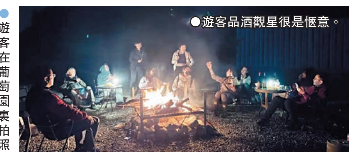
●遊客品酒觀星是愜意。