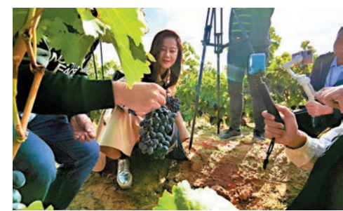
●遊客在葡萄園裏拍照留念。