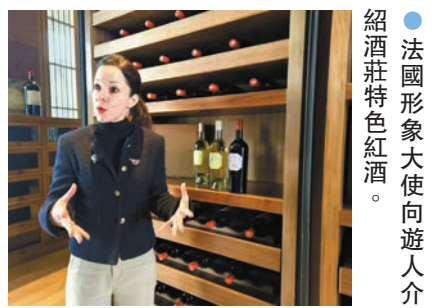
●法國形象大使向遊人介紹酒莊特色紅酒。