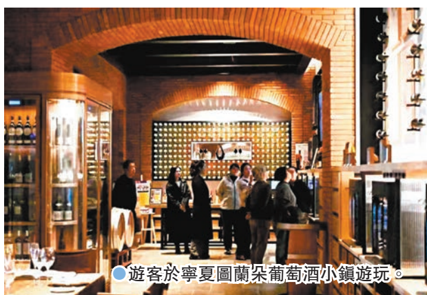
●遊客於寧夏圖蘭朵葡萄酒小鎮遊玩。

寧夏文化和旅遊廳還發布了20條賀蘭山東麓葡萄酒旅遊精品線路產品，研發推出5套賀蘭山東麓配餐產品，以酒莊為點，將葡萄酒與寧夏特色美食融合，與周邊旅遊景區串聯，使遊客的酒莊休閒之旅體驗感更強、旅遊層次感更加豐富。與此同時，各大酒莊向內發力，深挖酒莊特色，主動融入文化旅遊，文​​化產業發展為酒莊所帶來的人流量、曝光量，使葡萄酒產業的發展煥發勃勃生機。