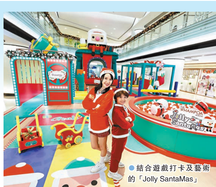
●結合遊戲打卡及藝術的「Jolly SantaMas」