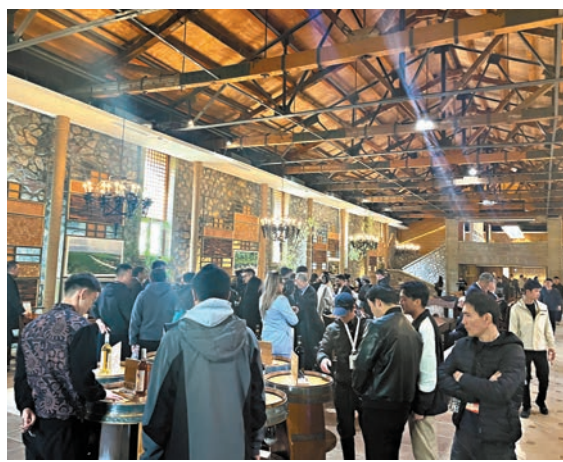
●寧夏圖蘭朵葡萄酒小鎮遊人如織。

酒莊中，A級旅遊景區酒莊已達14家，其中4A級景區酒莊4家，年接待遊客數量超過135萬人次，由旅遊帶動的葡萄酒銷售額佔總銷售額的50%。酒莊遊的品鑒環節是遊客與葡萄酒拉近感情最直接的方式，源於品鑒，遊客對葡萄酒有了更多的認知，這是葡萄酒與遊客之間建立的初級好感。