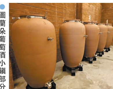
●特色桃木葡萄酒罐