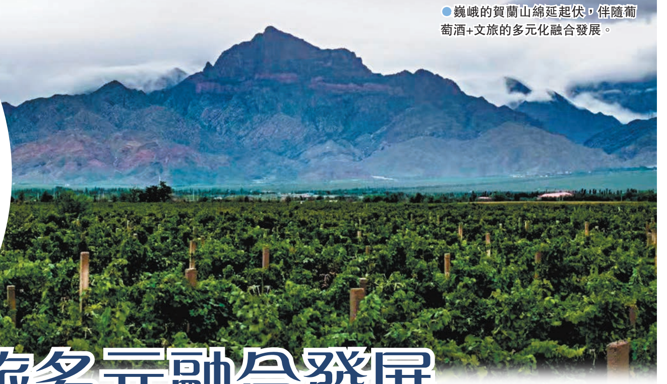
●巍峨的賀蘭山綿延起伏，伴隨葡萄酒+文旅的多元化融合發展。