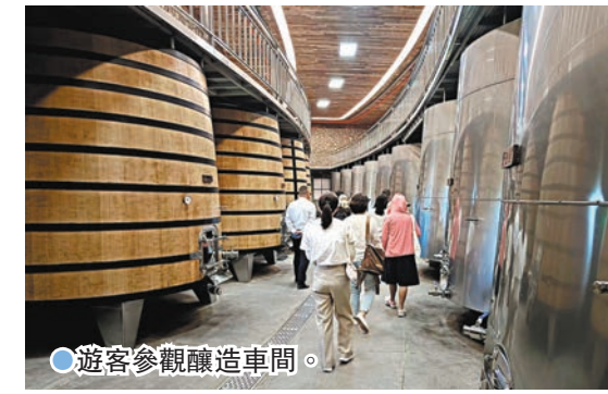
●遊客參觀釀造車間。