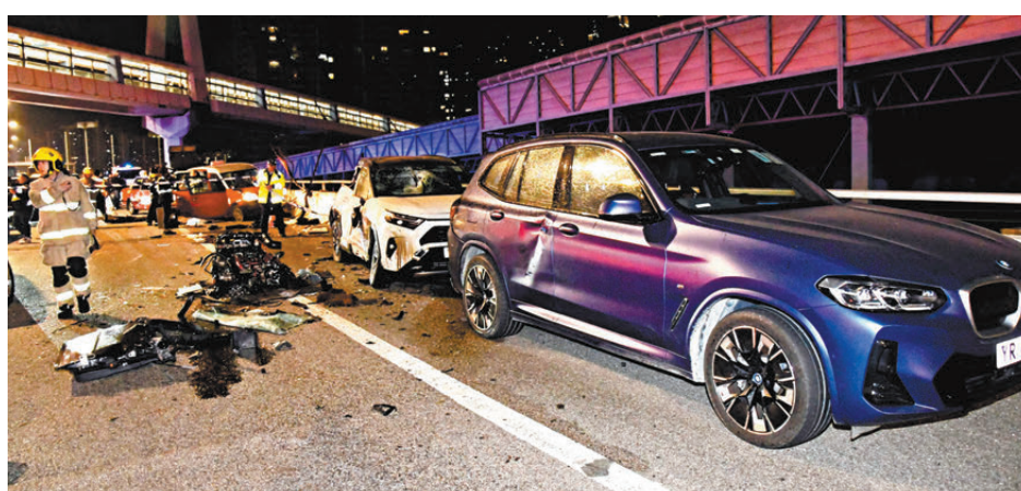
●西九龍公路6車相撞釀3死4傷，疑涉的士切線肇禍，警拘危駕司機。

香港文匯報訊（記者 蕭景源）西九龍公路與海城對開元旦凌晨發生3死4傷嚴重車禍，初步調查相信是一輛載客的士切線時，與高速飄至的黑色私家車相撞而導致連環巨烈撞擊，總共波及6輛車，涉事的士司機涉嫌危險駕駛引致他人死亡被捕。其中淪為「炮彈飛車」的私家上5名南亞裔男子3死2重創。據悉，男司機開車載4名同鄉好友外出慶祝元旦，詎料途中撞車，全車人傷亡慘重。從事運輸業的男死者和同車一名好友，均遺下年幼子女，家人失去經濟依靠，並希望警方查出事真相。