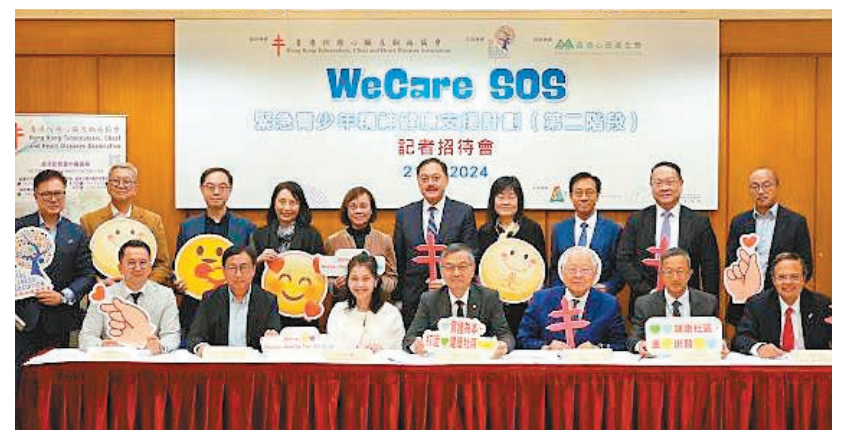
●「WeCare SOS計劃」早前發布第二階段資料，為有需要學生提供免費精神科診症和藥物治療資助。

她形容當天氣氛充滿正能量，有一位學生更笑言，此前只知道有身體的急救課程，但原來精神情緒也有急救，很開心能成為急救員，有需要時能幫助同學。