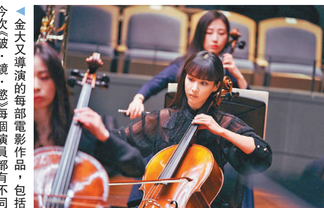
曹汝貞指今次角色令人有想挑戰的野心。