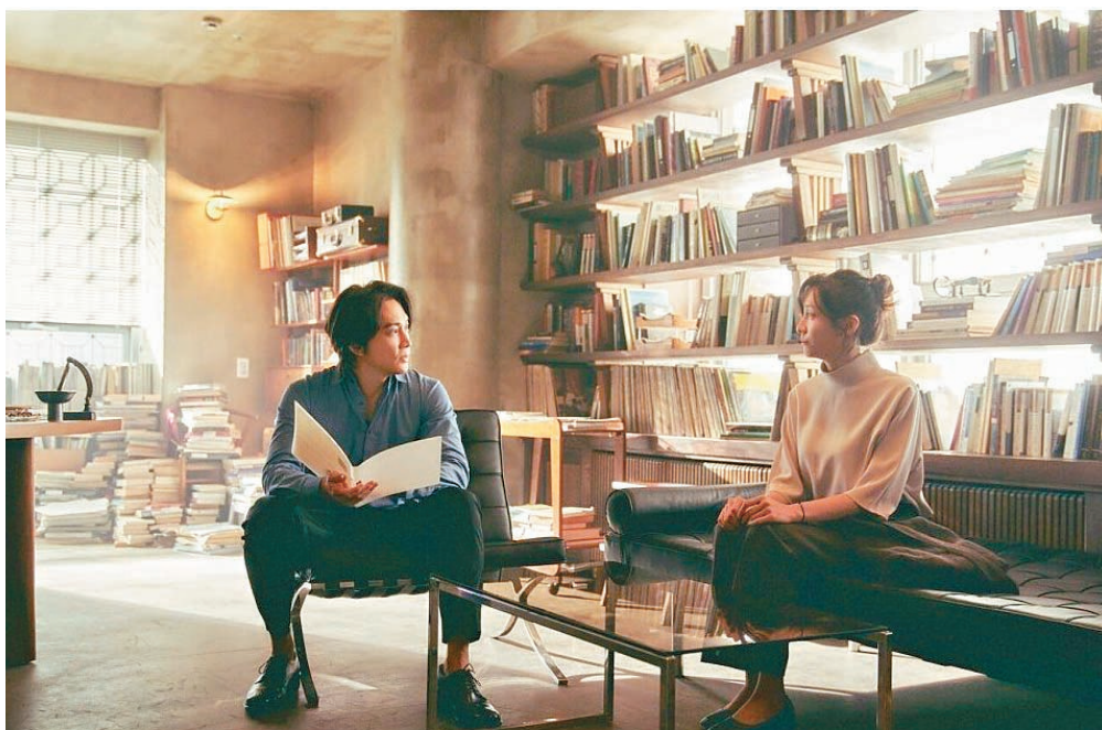
宋承憲飾演的管弦樂團指揮家，是他從未演過的角色。