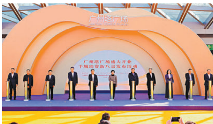
◀穗打造「羊城消費新八景」城市消費IP。