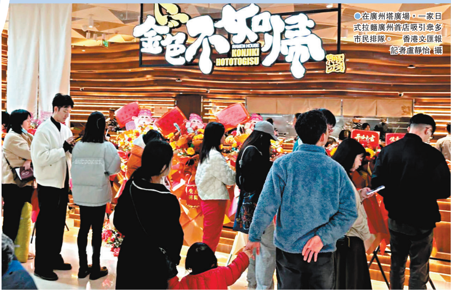
●在廣州塔廣場，一家日式拉麵廣州首店吸引眾多市民排隊。

在地標建築「小蠻腰」下，廣州塔廣場人潮如織，從中午開始就處處都需要排隊。一些作為廣州首店的餐飲店的等位號牌已經排到數百號，餐廳客流量大得驚人。「我是下午五點多到的，處處都人山人海，點個奶茶都要等40分鐘，所有餐館從5點開始就高朋滿座，客人都要等位。」廣州白領阿君表示，她也是想來一嘗某品牌在廣州的首家日式拉麵店，結果看到店外「大打蛇餅」，隊伍長到折了幾個圈。據了解，這家拉麵店過去僅在香港中環和上海陸家嘴兩地開店，首次在廣州開店，就吸引了不少人慕名前來品嚐。另一家來自香港的米芝蓮一星餐飲店「新斗記」亦客如輪轉，有食客表示排隊守候了一個多小時才排上，為此餐廳還特別送上甜品補償。