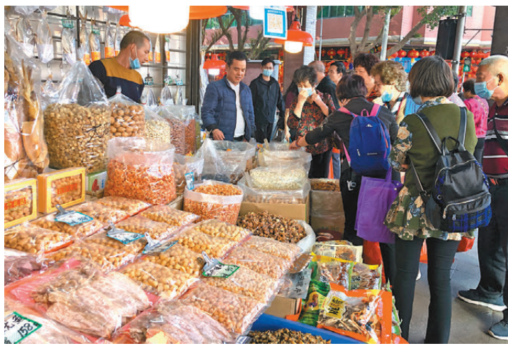
●港澳居民「北上」消費向多元化服務性延伸。圖為民眾在廣州「海味一條街」選購。

為搶攬港澳居民「北上」購物與過年熱潮，廣東不少城市都加快提供高品質產品供給，滿足「北上」消費多元化需求。其中，廣州正高標準打造天河路商圈、北京路商圈等吃喝玩樂購遊商旅綜合體，引進國際高端品牌，發展首店經濟，為港澳居民「北上」消費提供高品質商品。同時，珠海、廣州等城市也發揮嶺南文化底蘊優勢，擦亮老字號品牌與文旅資源，讓「北上」文化消費、情感消費成為特色。廣東其他城市也發揮「綠美廣東」等優勢，推出一系列「北上」綠美鄉村、森林生態旅遊路線，吸引港澳居民春節返鄉探親的同時，進一步挖掘「北上」消費潛力。