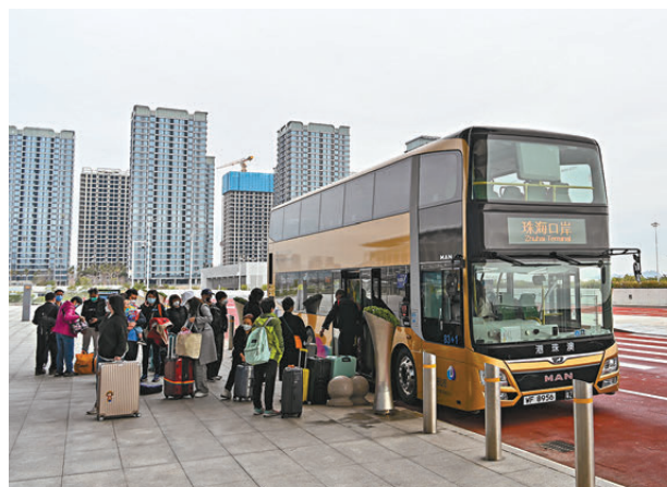
●春運期間，大橋穿梭巴士擬日均同比加開200班。圖為早前，旅客乘坐港珠澳大橋穿梭巴士抵達港珠澳大橋珠海公路口岸。