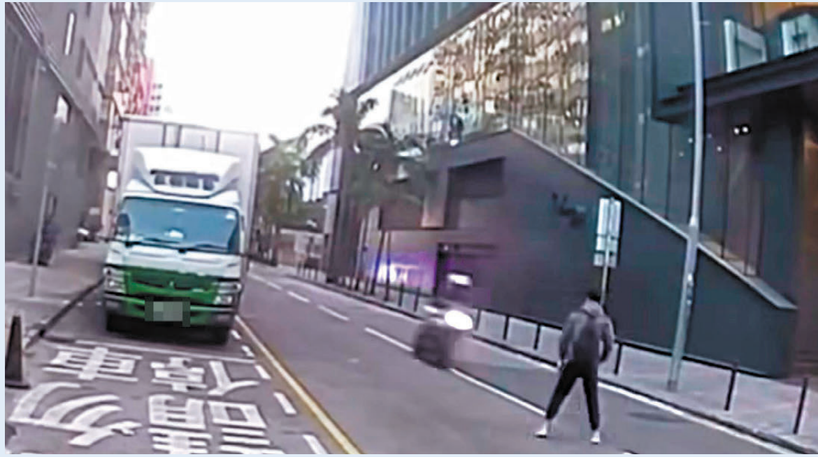
●一名男子站出馬路疑試圖阻截。