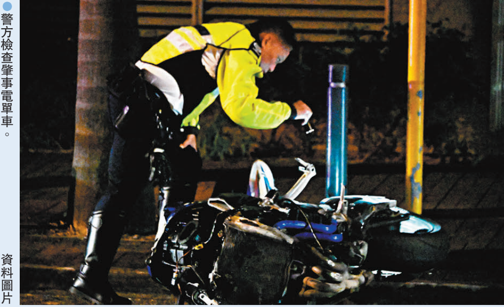
●警方檢查肇事電單車。