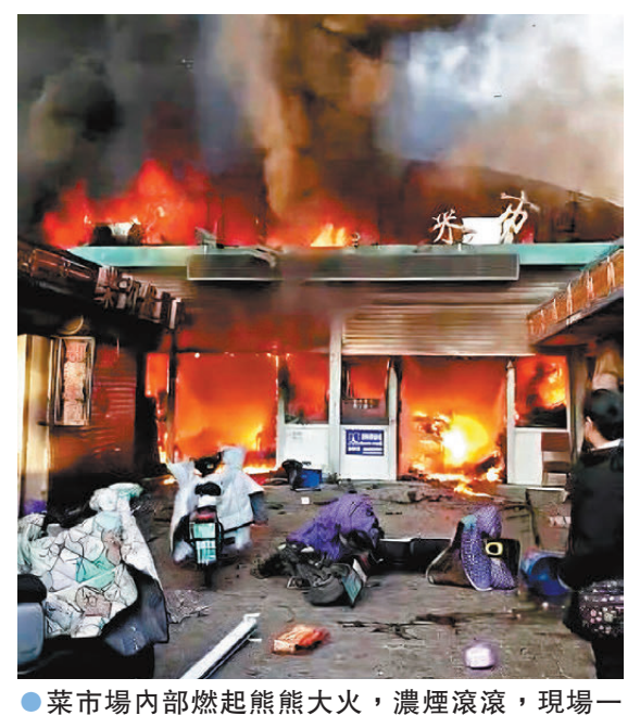
●菜市場內部燃起熊熊大火，濃煙滾滾，現場一片混亂。 視頻截圖

香港文匯報訊（記者 李瑩茵 河北報道）4日8時40分左右，河北張家口市橋西區廣菜市場發生火災，火情迅速蔓延，形勢危急。當地消防部門接警後，消防、應急、醫療等部門第一時間趕赴現場開展救援。10時10分，現場明火撲滅。12時50分，現場救援工作結束。橋西區政府辦工作人員透露，事故造成8人遇難，15人受傷。傷者已送往醫院救治，目前無生命危險。事故原因調查、善後工作等正在進一步開展。