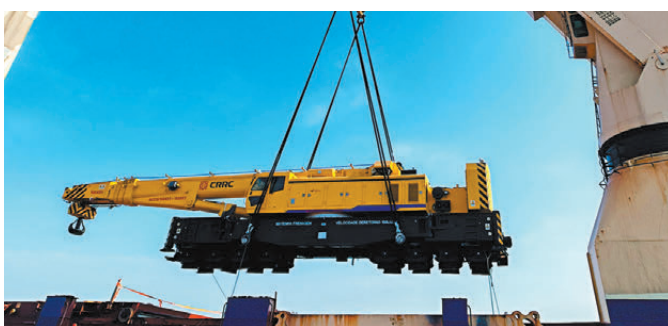
●中車齊車出口安哥拉鐵路起重機在上海港裝船。

NZS1601型160噸窄軌伸縮臂鐵路起重機最大起重量為160噸，最大起重力矩為1280噸·米，是安哥拉有史以來採購的最大噸位鐵路交通裝備，將用於安哥拉羅安達鐵路救援及道路施工作業，為當地鐵路的安全、高效運營提供有力保障。