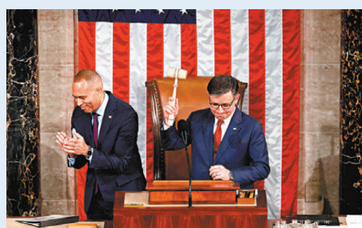
●約翰遜(右)在第二輪投票中獲選眾議長。

《華爾街日報》分析，約翰遜想要獲得黨內眾議員一致同意、通過上述法案，幾乎是不可能完成的任務。單是延長特朗普的減稅方案，就要花費多達4萬億美元(約31萬億港元)。多名溫和派共和黨議員已對此不滿，批評極右議員為滿足自身訴求劫掠議程。