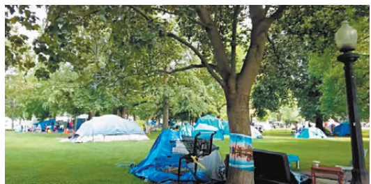
●多倫多最大露宿者帳篷營地位於市中心。

社會學者史密斯指出露宿者問題不易解決，因為當中需要大量協作，而且三級政府會否全力推行解決方案亦存在着很多疑慮。各地政府聲稱拆除露宿者營地，但很多時候是清理完一個營地後又有另一個營地形成。在2021年，多倫多市政府曾耗費200萬加元(約1,077萬港元)清理營地，但未見成效。收容中心負責人指出，清理營地不是良策，只會導致更多露宿者流離失所，人身安全完全沒有保障。