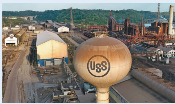
●美鋼行業數千個崗位岌岌可危。 資料圖片

多家外媒認為，這項收購案最終告吹，不僅意味美鋼行業數千個崗位岌岌可危，還將給美日同盟蒙上陰影，暴露「美國並非可靠夥伴」的切實證據。日鐵和美鋼在聯合聲明中就提到，「向任何考慮對美國進行重大投資的美國盟國的企業，發出了一個令人心寒的信號。」