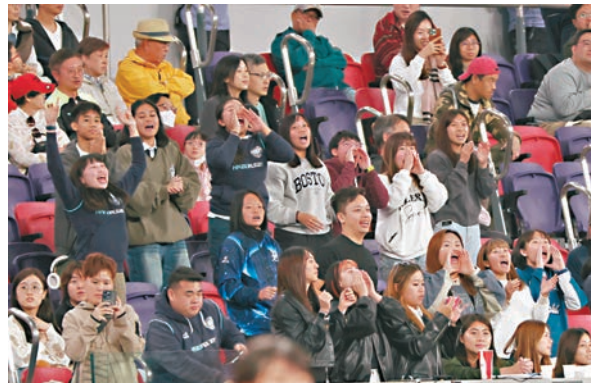
●大學生為各自的球隊吶喊打氣。 香港文匯報記者郭木又攝

邱先生從屯門到場觀賽，上午11時抵達。他向香港文匯報記者表示，入場時安檢過程十分暢順，「都幾鬆動，又不擁擠。」他於場內消費約140元購買熱狗與汽水，認為價格屬可接受範圍，「來之前已經有心理準備了，價格會相對外面高一些。一杯汽水加一份熱狗，其實140塊錢還好啦。」他對香港