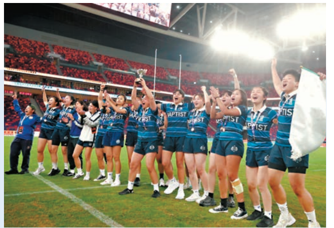
▲啟德體育園主場館首辦測試賽，舉辦大專欖球賽。傍晚6時許高峰期約有7,000人同時在場館內。