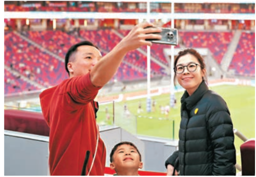
●不少觀眾入場後首先以世界級體育設施為背景來打卡。

擁有世界級場館感興奮，「場館真的很大，座椅和廁所都很新淨，我今次親眼看到真的很高興。」