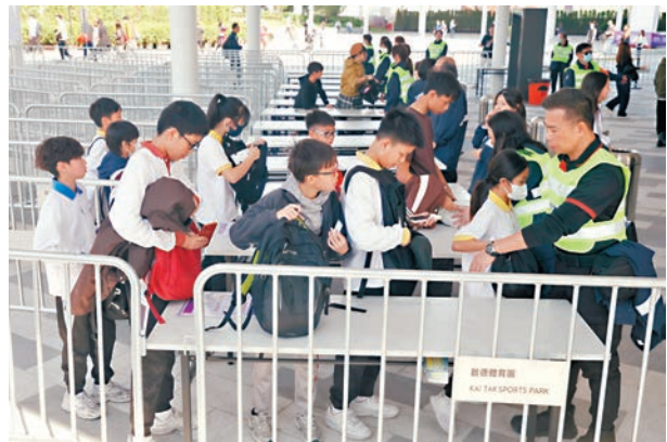
●啟德主場館大專欖球賽的觀眾輪候入場。

香港最大型體育基建項目啟德體育園落成後，昨日迎來主場館首場測試賽，由接近中午至傍晚進行近20場欖球賽，共有10,200人次進場觀賽，警方指傍晚6時許高峰期約有7,000人同時在場館內。香港文匯報記者在場內直擊，進場及散場時的人流進出均井然有序，場內氣氛亦相當熾烈。有入場人士表示，早上11時入場及安檢過程均十分順利，主場館擁有世界級水平，屬香港體育設施的重大