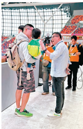
●保安局局長鄧炳強與入場觀眾互動。

對於是次測試人數只有可容納人數的五分之一，他表示未來會逐步提升，因為有些地方還有工程進行中，要逐步來，「未來會有至少三個有65,000人的大型測