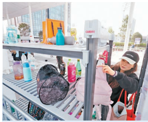
▲主場館有儲物架存放物品。

他表示，1月18日會在主場館舉行一場音樂會，料有1.8名觀眾入場；2月亦會有壓力測試，希望用盡主場館的容量。