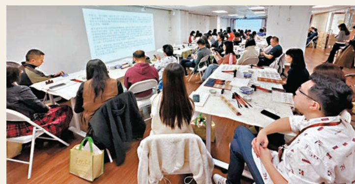
●培訓現場。