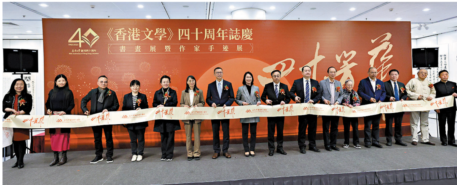
●香港文學出版社主辦「四十芳華——《香港文學》40周年誌慶書畫展暨作家手迹展」於昨日開幕。