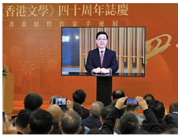
●特首李家超視像致辭。

香港文匯報訊 香港特區行政長官李家超昨日在《香港文學》40周年誌慶書畫展暨作家手迹展開幕式上以視像致辭，他強調，未來，特區政府會與不同業界持份者和本地文藝社群共同合作，並且帶動商界和其他界別的參與，攜手推動文化藝術和創意產業發展，進一步鞏固香港作為中外文化藝術交流中心的地位。