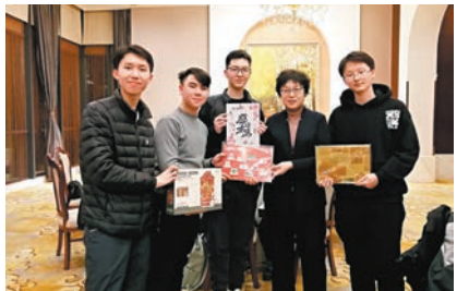
●來自香港同學們向辛靜部長表示感謝。

當晚，辛靜部長在長春南湖賓館設宴款待我們香港研學團一行。滿桌的吉林特色菜，令人目不暇給。有一道菜叫「黃金鈎」，很多香港孩子第一次見到那麼飽滿的「豆角粒」，瞪大了眼睛看不夠。席間，香港同學們向辛靜部長表示感謝的同時，更齊聲唱起了《我和我的祖國》《繁星》。大家從背包裏拿出專門從香港帶去的五星紅旗揮舞起來，暖意融融的房間霎時成了紅色的海洋。