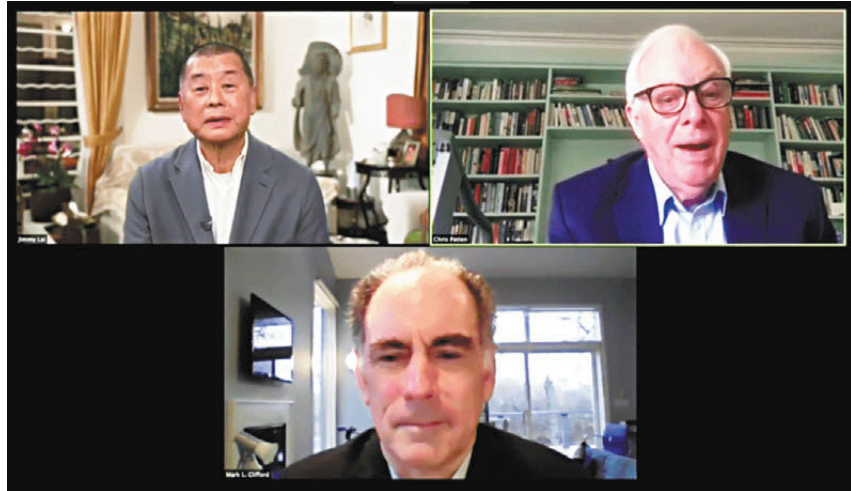
▲黎智英主持的《Live Chat with Jimmy Lai》訪談節目。