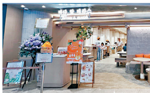
●涉事連鎖韓式餐廳「Terrace in seaside」又一城分店。

涉事餐廳「Terrace in seaside」周日(5日)回應，表示經內部調查後，涉事職員已被停職及被處分，又強調公司非常關注事件，對任何形式的性騷擾絕不容忍。公司已就《性別歧視條例》訂立防止性騷擾的政策和指引，同時加強相關培訓。若同事遇到任何不妥的情況，應即時向人事部或管理層反映，又指所有舉報消息都會保密，管理層亦保證會公平處理。