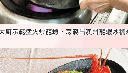
●大廚示範猛火炒龍蝦，烹製出澳洲龍蝦炒糯米飯。