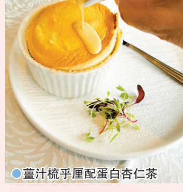
●採、攝：祖蓮娜 文：雨文

而中西四手套餐中的頭盤有「紅酒鵝肝汁伴蜂巢鮑魚」，這道絕對是花心思的功夫菜，洪師傅用上南非六頭鮑魚放在紅酒內約6小時，用提煉過的葱油冷凍後蒸6至8小時，再用鵝肝汁及紅酒慢火煮成醬汁，並將鮑魚炸至外脆內嫩，入口時鮑魚也滲出酒香，層次感豐富。套餐中的甜品是「薑汁梳乎厘配蛋白杏仁茶」，前者「梳乎厘」濃郁的蛋香和薑汁、軟滑的口感，還有手磨杏仁茶，每口都是杏仁香。