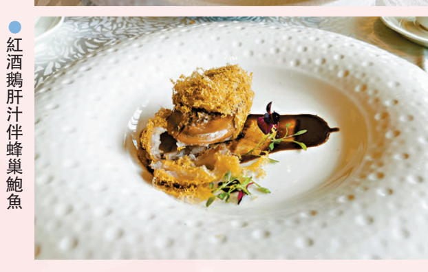
●紅酒鵝肝汁伴蜂巢鮑魚

口味。套餐前菜有「煙燻龍井素鵝」，素鵝內有冬菇絲、紅蘿蔔絲及筍絲，入口非常爽口，還滲出淡淡的煙燻茶香味，口感特別。主食是「澳洲龍蝦炒糯米飯」，先將糯米用溫水浸泡三個小時左右，放入冰箱隔夜，烹調時吃起來不會太黏膩，師傅先炒香糯米飯後再加上龍蝦和炸蔥，每口飯都滲出陣陣龍蝦的鮮香。