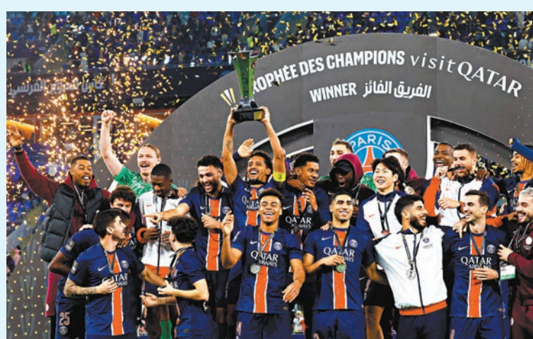
●巴黎聖日耳門享受勝利時刻。

PSG今場控球率達六成，全場共有28次射門、10腳中龍，主帥安歷基指球隊會建基於今場的表現再去進步：「奪冠會給予球員信心，他們在攻防端及跑動均表現積極，我們會以此去提升表現。」