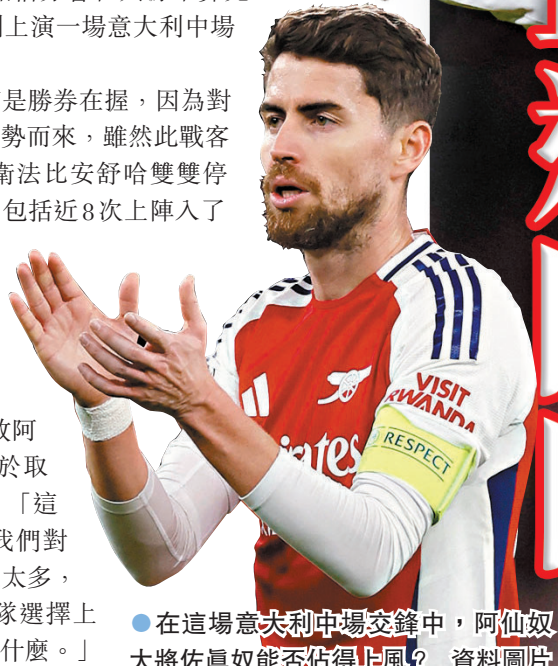
●在這場意大利中場交鋒中，阿仙奴大將佐真奴能否佔得上風？

今季英超首循環曾以1：0擊敗阿仙奴，紐卡素主帥艾迪維維對於取下這場聯賽盃大戰是志在必得，「這場比賽對我們來說意義重大。我們對今仗在本賽季的重要性不會幻想太多，而我們最近的優勢之一是在球隊選擇上保持一致，就讓我們看看能做到什麼。」