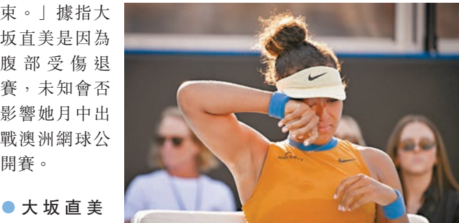
●大坂直美拭淚。

香港文匯報訊（記者 張發兒 綜合報導）四座大滿貫得主大坂直美周日出戰奧克蘭經典賽決賽，惟在領先一盤下因傷退賽，無緣打破四年來的冠軍荒。在接受醫療診斷期間，大坂直美情緒激動，不禁落淚。她出席頒獎禮時表示：「在這裏打比賽是一件開心的事，也十分享受，但很抱歉以這樣的方式結束。」據指大坂直美是因為腹部受傷退賽，未知會否影響她月中出戰澳洲網球公開賽。