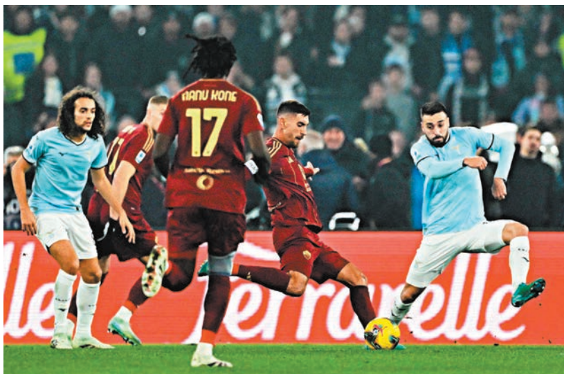
●羅倫素柏歷堅尼（右二）今季終於開齋。圖為他入球瞬間。

香港文匯報訊（記者 張發兒 綜合報導）意甲羅馬打吡在香港時間周一凌晨上演，羅馬最終憑羅倫素柏歷堅尼及沙利麥卡斯建功，以2：0擊敗拉素。羅倫素柏歷堅尼早前備受批評，更淪為後備，今場柏歷堅尼以一個入球報答救火教練雲尼亞里對他的信任。