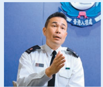
● 香港特區政府入境處助理首席入境事務主任李冠宇接受本報訪問。

若發現申請人或僱主有弄虛作假的情況，入境處會立即展開調查，並必要時將個案轉介相關執法部門處理。他強調，入境處將繼續採取多層次的監管措施，確保輸入勞工計劃符合政策原意，避免被濫用。