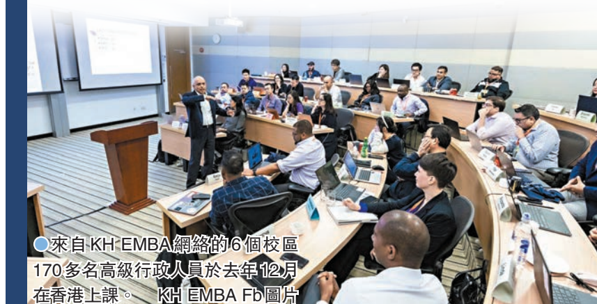
●來自KH EMBA網絡的6個校區170多名高級行政人員於去年12月在香港上課。

他笑說，很多人以為EMBA學費很貴，尤其是「世一」EMBA，但是事實上KH EMBA的學費相比美國大部分同類課程都要便宜，「所以同學們來到香港讀書的話，性價比絕對是甚高的。」