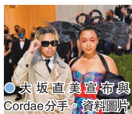
●大坂直美宣布與Cordae分手。資料圖片

香港文匯報訊 剛於奧克蘭舉行的網球賽錯過打破冠軍荒的良機，日本籍網球名將大坂直美昨天又證實，自己與饒舌歌手男友Cordae結束六年情。大坂直美在社交媒體上寫道：「大家好，我在這裏宣布我與Cordae已經和平分手了。他是一個好人，一個優秀的父親。很高興與彼此曾經相遇，因為女兒是我人生最大的禮物，我也從這段關係中成長了很多。」兩人於2019年相戀，2023年誕下女兒。