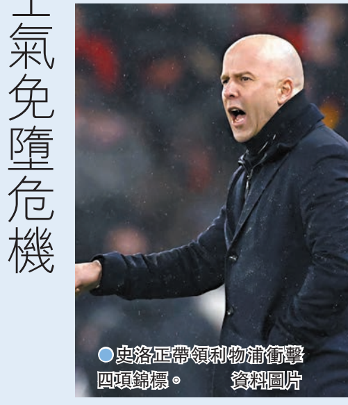
●史洛正帶領利物浦衝擊四項錦標。