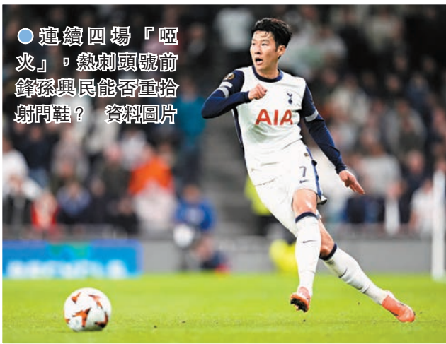
●連續四場「啞火」，熱刺頭號前鋒孫興民能否重拾射門鞋？資料圖片