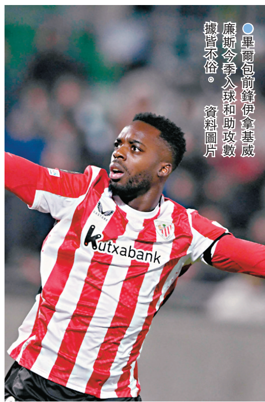
●畢爾包前鋒伊拿基威廉斯今季入球和助攻數據皆不俗。資料圖片

香港文匯報訊（記者 張發兒）將於香港時間9日凌晨在西班牙超級盃4強出戰畢爾包的巴塞隆納賽前傳出壞消息，隊中進攻中場丹尼爾奧莫再度被拒絕註冊，雖然他被列入出戰西超盃的大軍名單，但仍未知能否在這項於沙特阿拉伯舉行的賽事中披甲，而奧莫更有可能因此不能代表西班牙國家隊出戰。（本港時間周四凌晨3：00a.m.開賽）