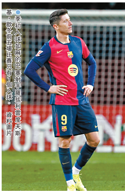
●季初入球如麻的巴塞射手羅拔利雲度夫斯，歐戰前兩場比賽只有1個入球。