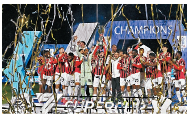
●AC米蘭在決賽中反勝意甲衛冕冠軍國際米蘭，捧起意超盃冠軍獎盃。

這項在沙特阿拉伯舉行的上屆意甲冠軍和意盃冠軍參與角逐的意大利超級盃，干斯卡奧剛接掌兵符先帶領AC米蘭反勝祖雲達斯殺入決賽，7日凌晨決賽面對國際米蘭，A米一度被拿達路馬天尼斯及泰尼米射破大門落後兩球。不過干斯卡奧隨即調整戰術及換人，終憑迪奧靴南迪斯、基斯甸普列錫及譚美阿巴謙的入球以3：2反勝同市死敵國際米蘭，第8次於意超盃封王。