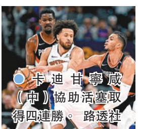
●卡寧咸（中）協助活塞取得四連勝。

香港文匯報訊 綜合外電報道，昨日美職籃（NBA）常規賽，底特律活塞憑藉狀元後衛卡寧咸攻下32分和9助攻帶動下，主場以118：115力克波特蘭拓荒者，收下自2019年3月以來的首個四連勝。今年23歲的卡寧咸是2021年NBA的新秀狀元，本賽季持續進步，場均貢獻24.4分、投籃命中率45%及三分球命中率37.7%都是生涯新高，而且場均9.5次助攻亦在本賽季NBA排名第三。