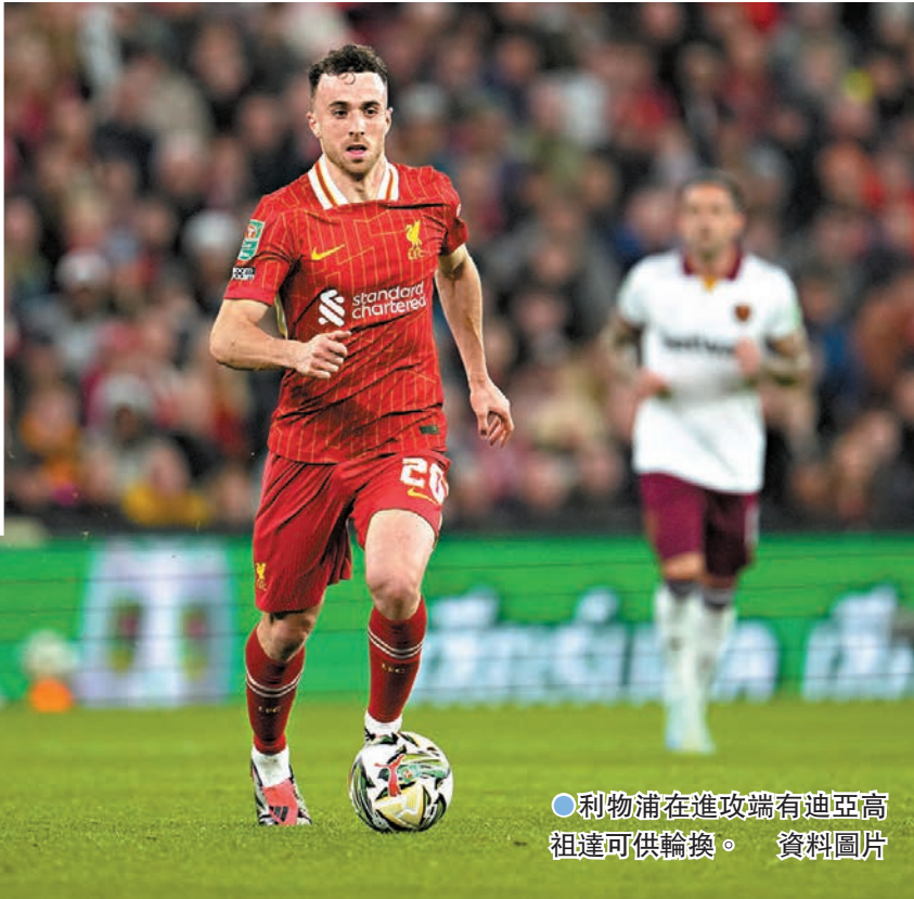
●利物浦在進攻端有迪亞高祖達可供輪換。