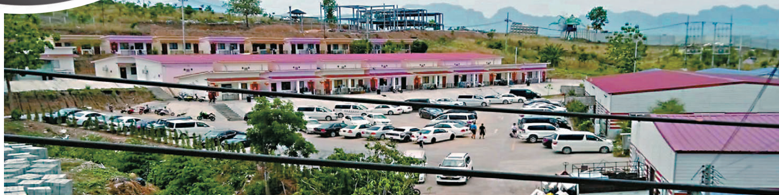
●網上流傳的KK詐騙園區圖片。 資料圖片