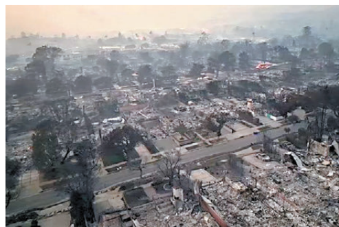
●重災區太平洋帕利塞德被燒成廢墟。

據研究公司First Street表示，太平洋帕利塞德此前數十年來沒有發生過山火，但該地區96%的房屋在未來30年將面臨山火風險。負責人波特說，「這些地區面臨着巨大風險，因為周圍都是公園，容易助燃山火。」