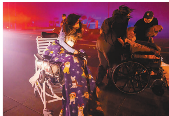
●坐輪椅長者撤離時需要協助。

香港文匯報訊 美國南加州洛杉磯縣的山火陷入失控，已造成至少5人死亡。目前火頭增至6處，火勢波及荷里活地區，多位明星的豪宅被燒毀。洛杉磯縣至少15萬人接到撤離命令，南加州逾150萬居民斷電。商業氣象預報公司AccuWeather稱，今次山火導致的破壞及經濟損失，初步預計達520億至570億美元（約4,046億至4,435億港元）。若未來數日有大量建築物被焚毀，或成為加州現代史上最嚴重的山火。