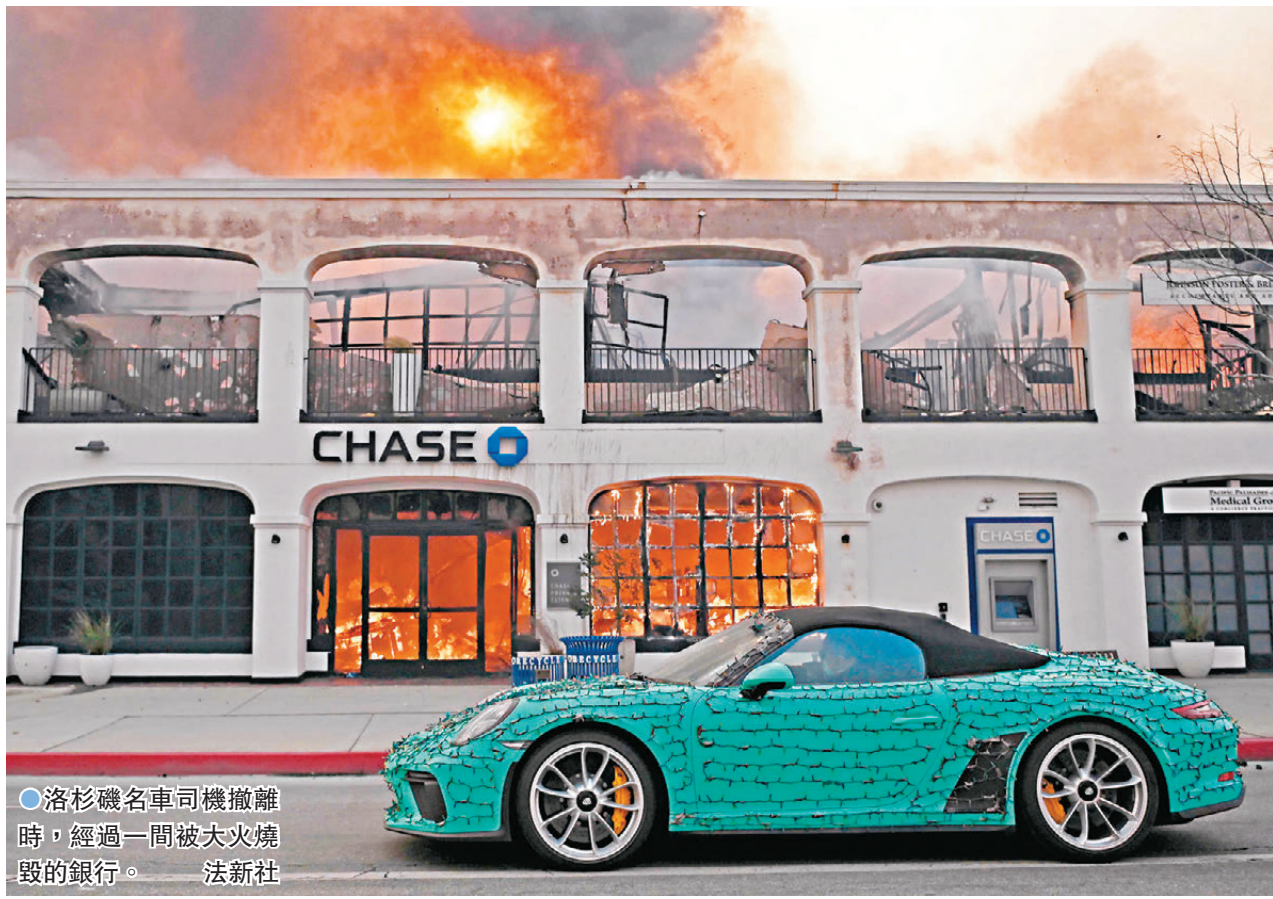
●洛杉磯名車司機撤離時，經過一間被大火燒毀的銀行。