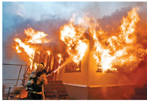
●出動救火的消防員面對缺水問題。