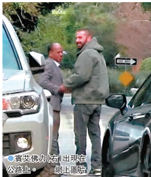
●賓艾佛力(右)出現在公路上。

美國總統當選人特朗普周三在名下社媒Truth Social接連發文，批評山火造成的嚴重災情，象徵拜登和民主黨籍加州州長紐瑟姆的無能。他指控紐瑟姆任內未將北方水源引進加州，導致加州民眾付出慘痛代價，又指當地消防栓沒有水、聯邦緊急事務管理署沒有錢，指這就是拜登留給特朗普的問題。