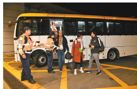
●國泰兩航班乘客疑食物中毒人數累計增至36人。圖為當日乘客被送往北大嶼山醫院接受治療。

中心正循不同方面全面調查兩宗個案，包括審視出現病徵人士病發前曾進食的食物，包括相關航班提供的共同食