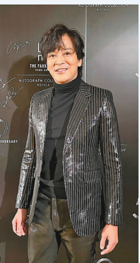
●陳曉東透露會回港過年。