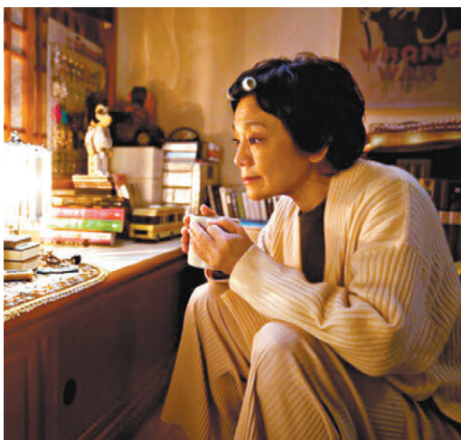
●今屆只有張艾嘉一位華人演員獲提名角逐「最佳女主角」。