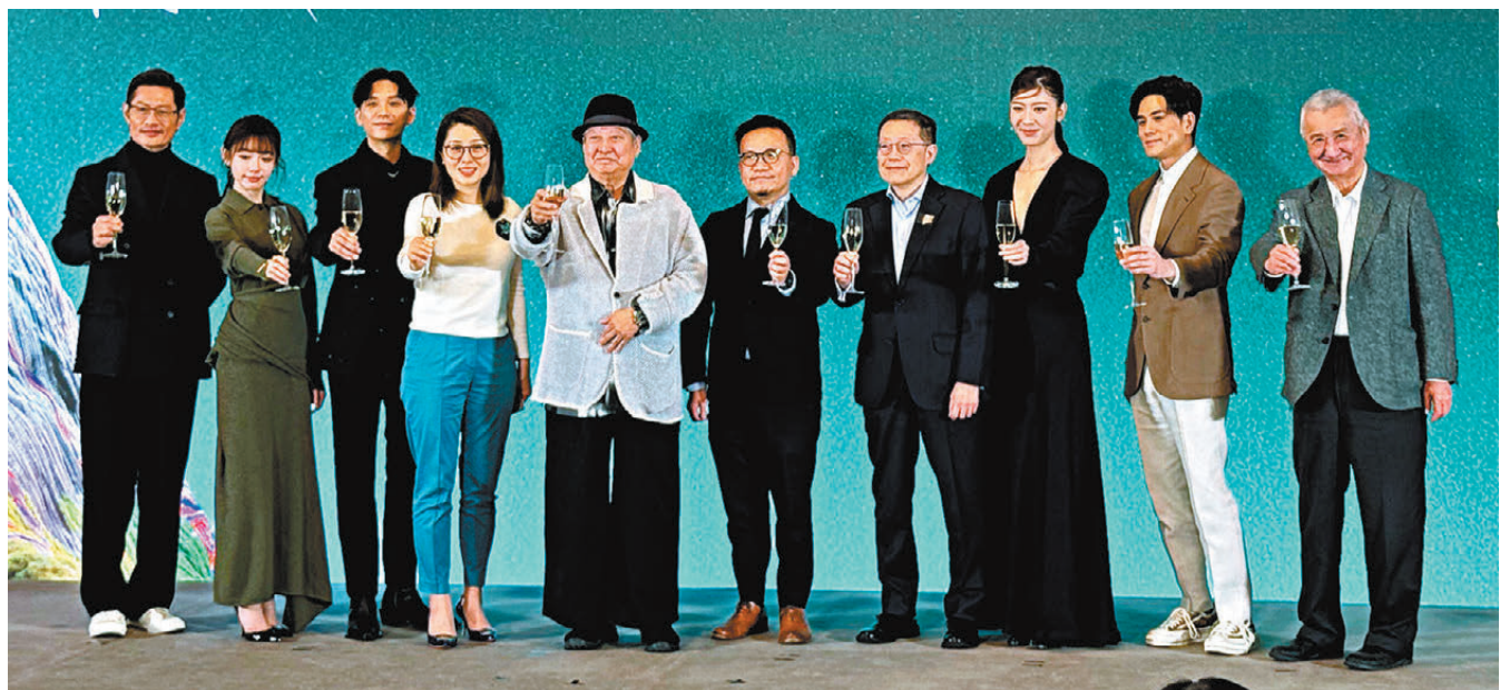
●「第18屆亞洲電影大獎頒獎典禮」記者會昨日舉行，並公布入圍名單。

香港文匯報訊（記者 阿祖）「第18屆亞洲電影大獎頒獎典禮」將於3月16日假西九文化區戲曲中心舉行。本屆亞洲電影大獎共涵蓋30部來自25個國家或地區的優秀電影作品，角逐16個獎項。昨日亞洲電影大獎舉行記者會公布入圍名單，當中亮點有《九龍城寨之圍城》獲9項提名，是今屆入圍最多獎項的華語電影；許冠文、劉青雲及彭于晏3位華語男星對決日本演員長塚京三及韓星崔岷植競逐「最佳男主角」；相反「最佳女主角」方面，則只有張艾嘉一位華人演員獲提名。