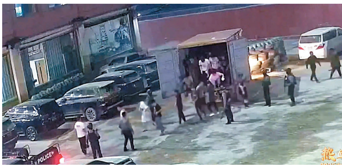
緬甸電詐集團通過高薪招聘、組織偷渡等方式大肆招募人員到園區從事針對中國公民的電詐犯罪。