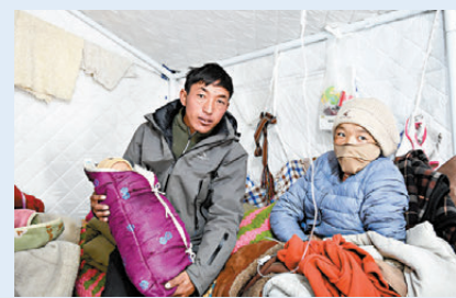
●1月10日，西藏定日，美久一家合影。