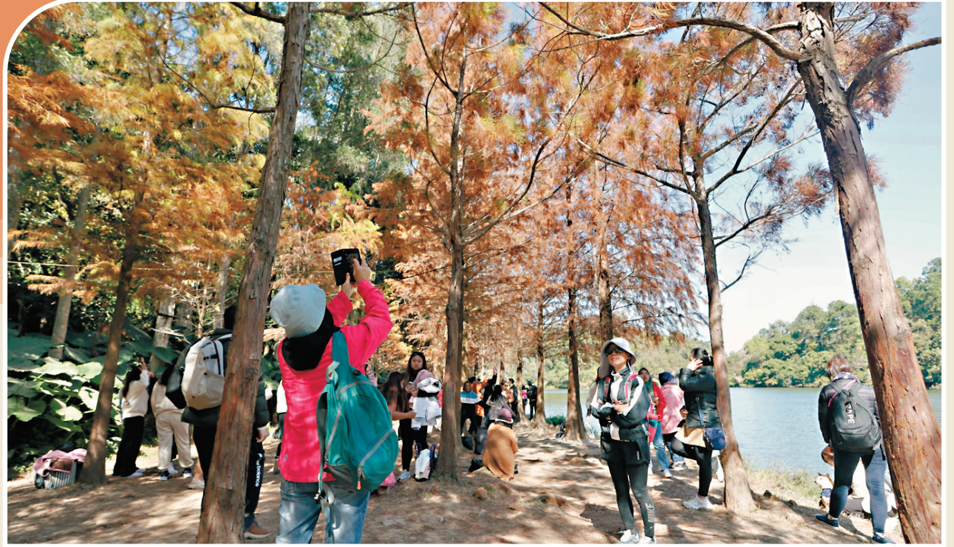
●大批市民昨天趁周日約親友，拖男帶女前往流水響水塘落羽杉樹群欣賞紅葉。

至於流水響的紅葉，他建議政府可提供一些資金種植更多的落羽杉樹，吸引市民及旅客到場觀賞，「秋冬天時，滿山都是這種樹，一定很美麗，不輸其他地方。」他並建議在社交平台多做自然景點的宣傳工作，「前往流水響水塘的小巴在粉嶺站上車，內地旅客過關後過去非常方便。」