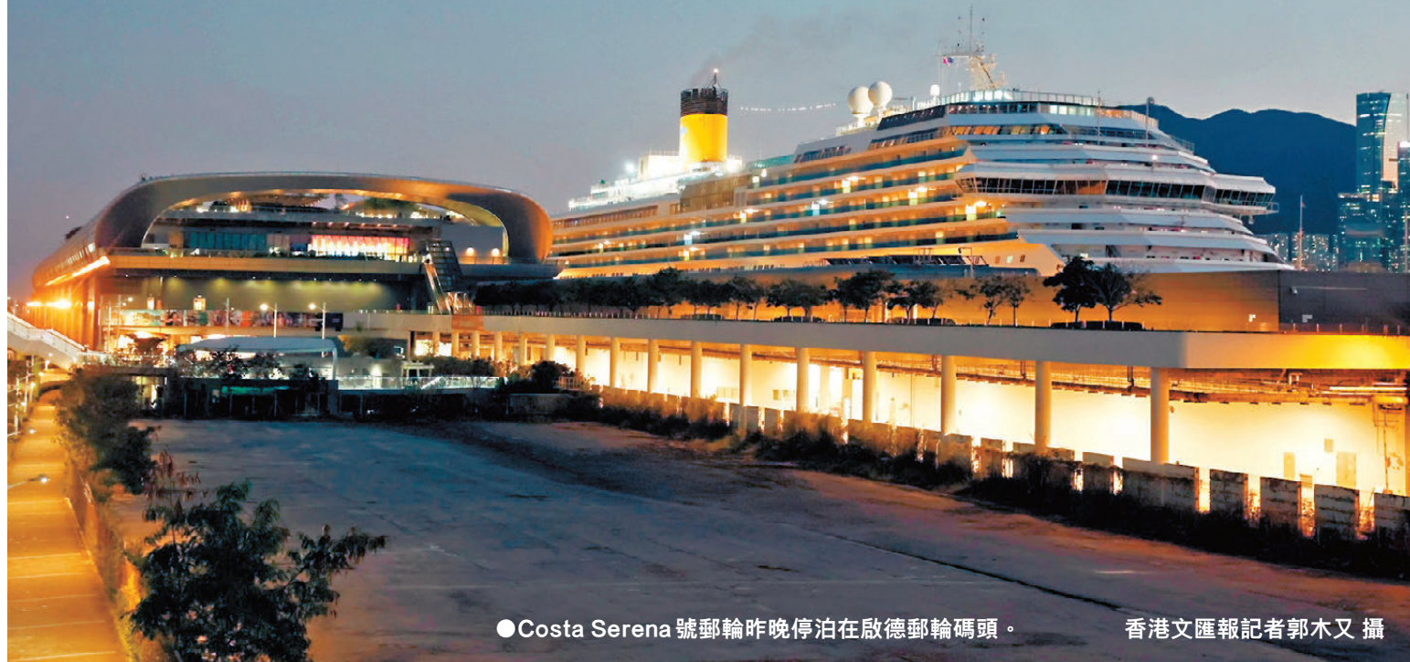
●Costa Serena 號郵輪昨晚停泊在啟德郵輪碼頭。