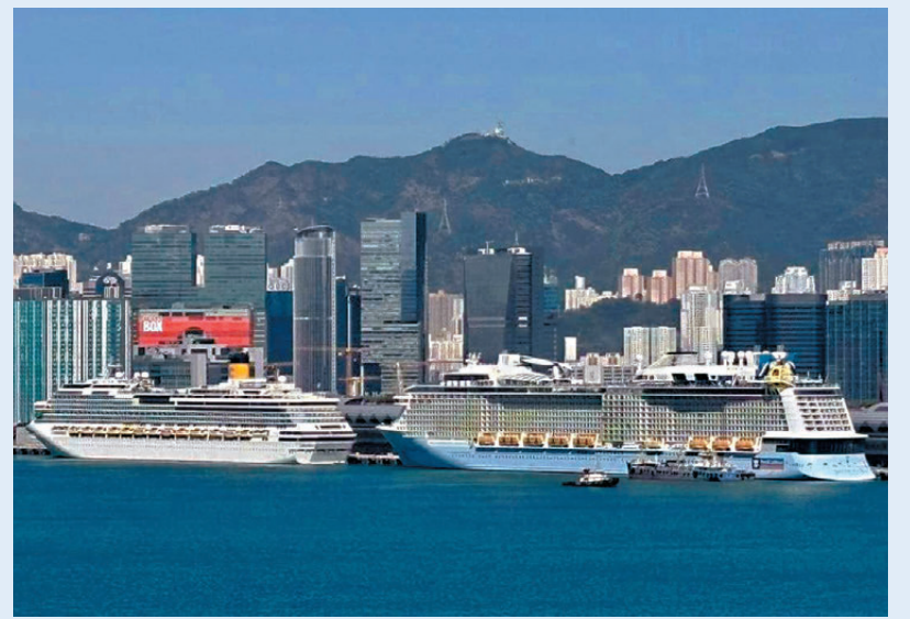
●兩艘大型郵輪海洋光譜號 (Spectrum of the Seas) 和 Costa Serena 號曾同時停泊在啟德郵輪碼頭。