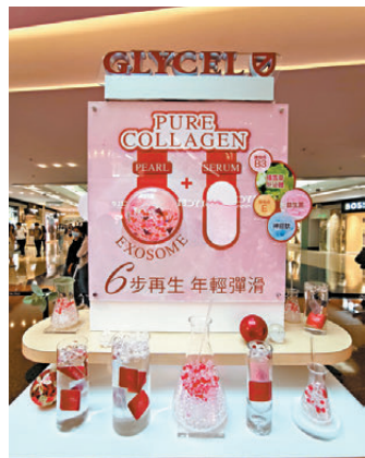
●「冰肌膠原珠」及超幹細胞「奇跡復活精華」。

要想逆轉肌齡，就需要冰封膠原。瑞士肌膚細胞再生專家 GLYCEL 堅持從肌膚細胞出發，研發出多款高效細胞更新護膚品。最近品牌再創劃時代護膚科技，以全新科研突破未來肌再生術，推出全新 The Pure Collagen 冷凍膠原凝時空煥膚膠囊，每粒蘊含以醫療級「冷凍」技術凝結的高濃度活性純深海膠原，結合「Exosome 幹細胞外泌體」，一粒即可凝時逆齡 Freeze & Rebirth，還「原」緊緻彈滑，成就未來肌！