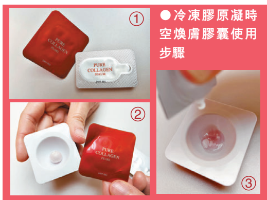
●冷凍膠原凝時空煥膚膠囊使用步驟

其獨特科研技術結合高濃度活性純深海膠原「冰肌膠原珠」及超幹細胞「奇跡復活精華」，達到先冰封凍齡 Freeze，後復活逆齡 Rebirth，當中冰肌膠原珠採用醫療級「冷凍昇華