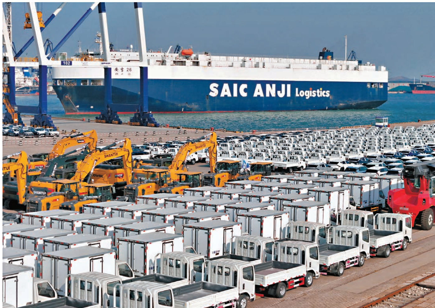
●中國汽車產業「馬力十足」。中國汽車工業協會13日發布數據，2024年中國汽車產銷量均超3,100萬輛，連續第二年產銷量均突破3,000萬輛，也是連續第十六年穩居世界第一。圖為大批國產汽車在山東煙台港集結等待裝船出口。

香港文匯報訊（記者 張帥 武漢報道）中國汽車產業「馬力十足」。中國汽車工業協會13日發布數據，2024年中國汽車產銷量均超3,100萬輛，連續第二年產銷量均突破3,000萬輛，也是連續第十六年穩居世界第一；新能源汽車年產銷量均首次突破1,200萬輛，實現跨越式發展，亦連續十年領跑全球，凸顯中國汽車產業的韌性和活力。