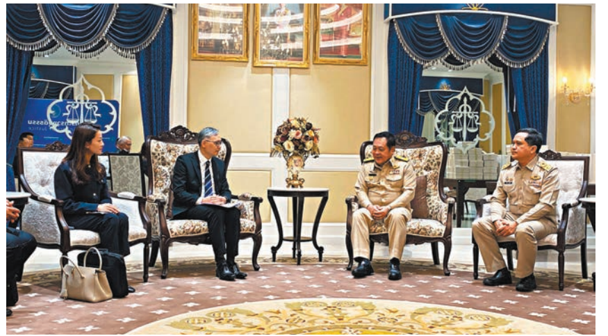
●泰國司法部部长塔威(右二)會見卓孝業(左二)及專責小組。

示，泰國總理主持的打擊販運人口活動委員會的成員、泰國司法部部长塔威率領司法部轄下的執法部門首長，包括專責打擊販運人口活動的部門，於昨日上午會見了專責小組。他在會上反映了有關港人求助個案情況及交換情報，獲對方積極回應，塔威表示泰國當局高度重視有關情況，並盡力協助求助的港人盡快安全回家。