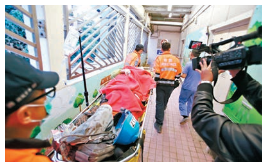
●其中一名傷者由救護車送院急救。

涉事地盤為啟德新急症醫院地盤B地盤D座大廈，樓高15層。消防處高級消防隊長陳振維表示，消防於昨午約3時59分接獲報案，到場後發現有7男4女工人受傷，其中10人在地面待援，另有1名女工被困在離地約3米的棚架上，需由高空拯救隊救下。11名傷者經送院救治後，1名47歲男子和3名分別53歲、50歲及61歲女子情況危殆，另有1名男傷者情況嚴重。