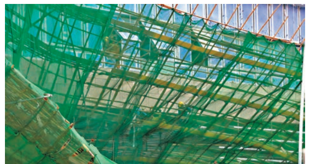
●消防員到場拯救被困棚架傷者。