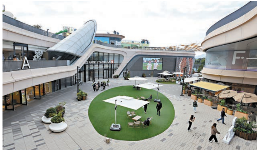
●即將開幕的「西沙 GO PARK SPORTS」。

這個由新鴻基地產發展有限公司發展的西沙大型綜合項目位於烏溪沙和西貢市中心之間，內含佔地約30萬平方呎的「西沙 GO PARK」運動商業綜合部分，以及逾100萬呎的多元化戶外運動公園「GO PARK SPORTS」。後者設有室內外多個專業運動場地，包括板網球場（Padel）、棍網球場（Lacrosse）、匹克球場、標準網球場、足球場、三人籃球場、滾軸溜冰場及公眾高爾夫球練習場等。