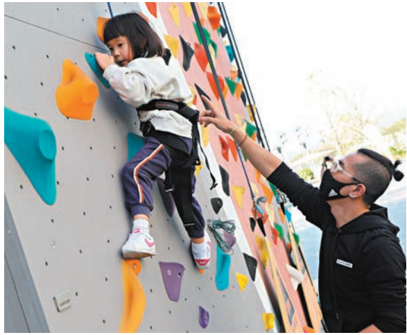
●園內大部分運動場地與課程現已開放預約租用。

香港文匯報訊（記者 蔡學怡）由香港中華總商會、香港福建社團聯會主辦的大型主題圖展「今昔香港」昨日在東區鯉魚涌社區會堂隆重開幕，本次展覽共分5個單元，從背靠祖國、百年變身、中西薈萃、民俗節慶及體育運動等方面，展現香港社會風貌的變遷。有參觀的香港市民和旅客昨日接受香港文匯報訪問時表示，老照片讓逝去的事物彷彿重現，冀更多年輕人可以深入了解香港歷史。