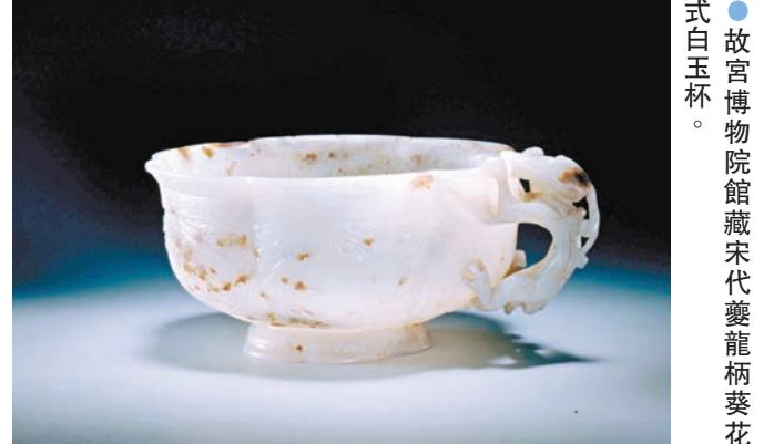
●故宮博物院館藏宋代夔龍柄葵花式白玉杯。