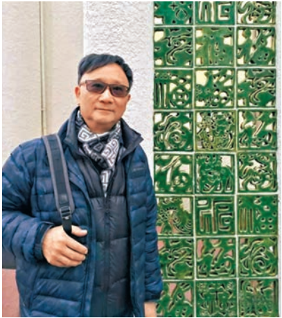
●西星帶學生打造的「謙仁是福」壁飾靈感源於中國剪紙。