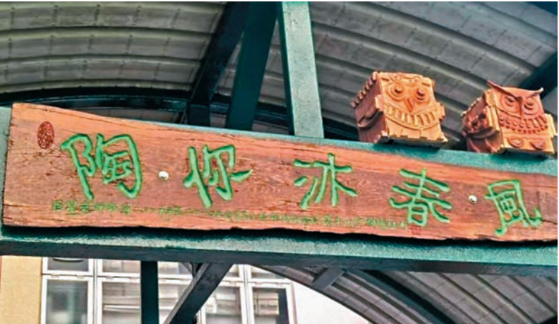
●校園內春風亭上的「陶你沐春風」牌匾。