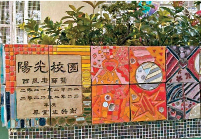
●西星與學生一同打造的陶瓷花壇牆。