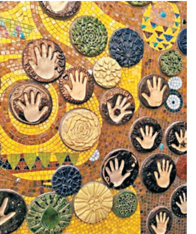
●校園內的「有圓相聚」陶藝牆。