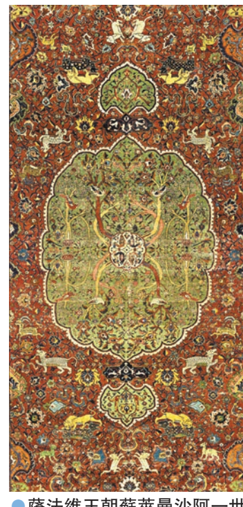
●薩法維王朝蘇萊曼沙阿一世「打獵」地毯。

香港首個大型伊斯蘭藝術展覽「文明交織: 多哈伊斯蘭藝術博物館地毯珍藏」(暫名)將於年中登場, 展出約100件文物, 包括伊朗、土耳其、印度的精美地毯、瓷器、金屬工藝品、古籍及玉器等。而與英國維多利亞與艾爾伯特博物館合作的「莫臥兒王朝的珍寶」(暫名)展, 則將展出莫臥兒王朝「黃金時代」最著名的三位君王所創造的非凡藝術成就。