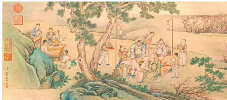
●清朝畫家丁觀鵬的《夜宴桃李園圖》(局部)。

春節前, 「香港賽馬會呈獻系列: 修明武備——故宮博物院藏清代軍事物」展覽將登場, 這是香港近年首個以清代宮廷武備為主題的大型展覽。王伊悠介紹, 紫禁城不僅是清朝政治