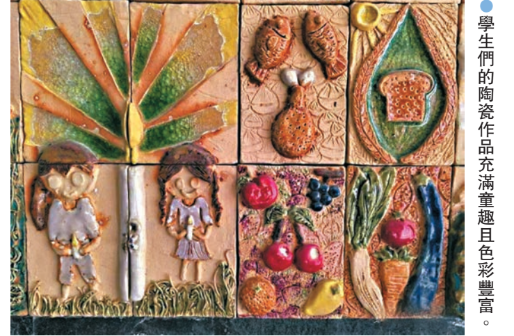
●學生們的陶瓷作品充滿童趣且色彩豐富。