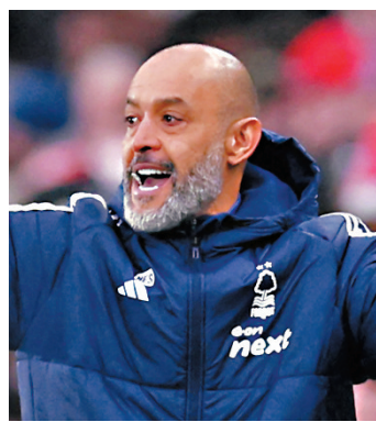
●今年50歲的葡萄牙籍教頭紐奴，成功將森林由護級球隊改造成爭標黑馬。資料圖片