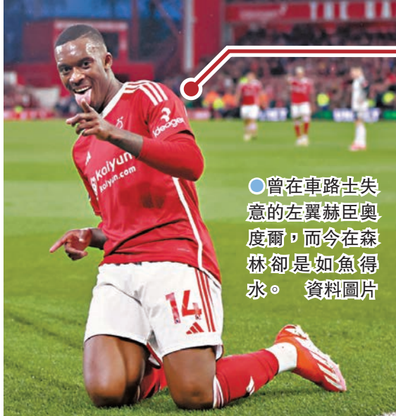
●曾在車路士失意的左翼赫臣奧度爾，而今在森林卻是如魚得水。資料圖片