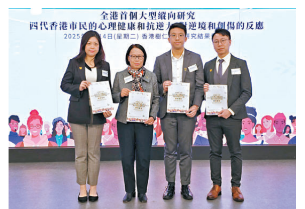
●香港樹仁大學的大型心理研究結果顯示,Z世代年輕成年人多達三成有焦慮徵狀,遠高於其他年齡群。

和逆境教育只是「斷斷續續,無持久性,隨便教一堂」,是較大的缺失,認為應從學校教育入手,幫助每個人裝備好應對逆境和創傷的能力,「不要等到有病才教他們(年輕人)處理情緒。」