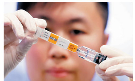
●警方於記者會上安排人員示範如何快速檢測太空油毒品。