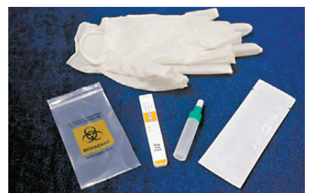
●警方引入的快速檢測工具包,內有獨立包裝的檢測棒、溶液、即棄手套等。

香港警方針對太空油毒品引入的快速檢測工具包,包括一支獨立包裝快速檢測棒、一支溶液、一個密封棄置膠袋及一對即棄手套。快速檢測工具包的使用程序非常簡單,人員只需先戴上手套打開獨立包裝的檢測棒,以檢測棒前端的試紙拭擦煙油彈的吸氣口或煙油注入口3次至5次,然後將試紙浸在溶液內至試紙上波浪紋的位置,可在浸入溶液10秒至15秒後取出檢測棒。