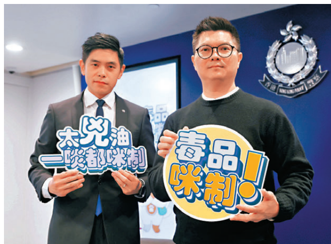
●警方昨日公布引入快速檢測工具包,協助前線警員更有效打擊太空油毒品。