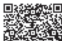
馬會《駿步人生》足本閱讀