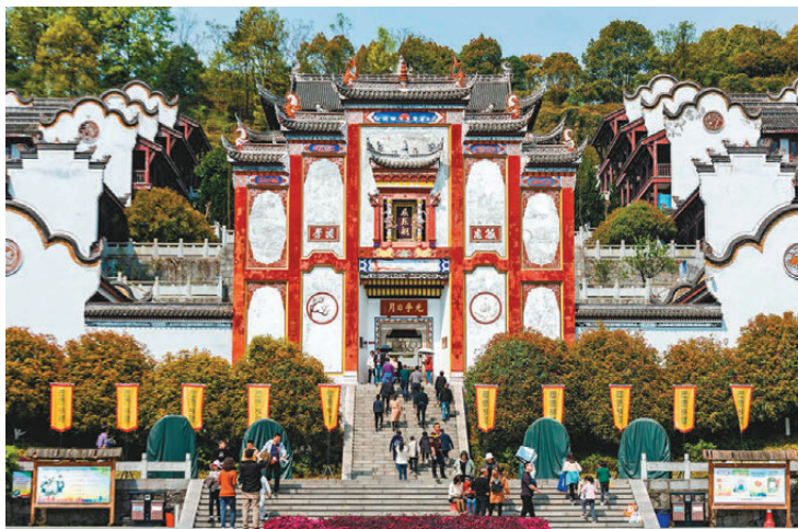
圖為位於湖北宜昌秭歸縣的屈原祠。資料圖片

屈原「博聞彊志，明於治亂，嫻於辭令」（司馬遷《史記·屈原賈生列傳》），早年深受楚懷王寵信而擔任要職，曾提出「聯齊抗秦」的外交策略，以期協助楚國實現統一大業；後來楚懷王聽信讒言，屈原遭受誣陷而被流放沅、湘之地。