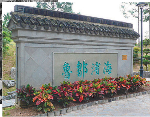
九龍寨城公園的牆上書有「海濱鄒魯」。資料圖片

明》，英國政府於1997年7月1日將香港交還給中華人民共和國。1987年兩國達成協議，清拆九龍寨城，並於原址興建公園，盡量保留寨城一些原有的建築物及特色，寨城公園竣工後只留下衙門、石額、牆基、石樑、柱礎、古炮等。