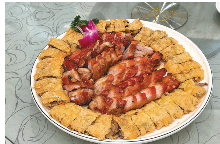
圖為「燒豬腩肉拼金衣鳳冠脆卷」。

● 葉德平博士（香港教育大學「文化傳承教育與藝術管理榮譽文學士」課程統籌主任、「戲曲與非遺傳承中心」副總監，曾出版多本香港歷史、文化專著。）