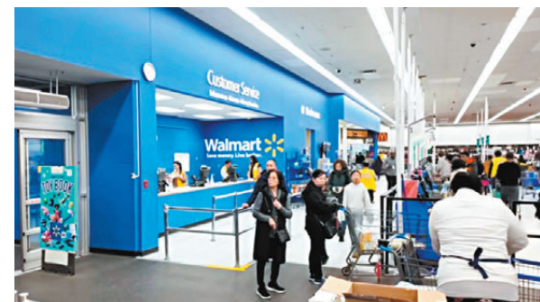
●沃爾瑪是其中一間遭集體訴訟索償的連鎖超市。