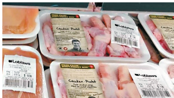
●Loblaw出售的肉類產品被指不足秤，違反聯邦法例。

保障消費者權益組織指出，即使超市計算重量時出現細小錯誤，長期都會為超市帶來巨額利潤，涉及的總額可能達到數百萬加元，因此該組織力促當局嚴懲違規的超市，讓消費者得到補償。