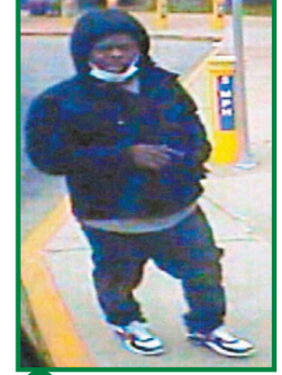
▲專家指閉路圖像參差，圖為美警方使用的畫面。網上圖片

無辜者身心受創「我怎能打敗機器？」 香港文匯報訊 在《華盛頓郵報》報道的8宗人臉識別技術冤案中，當事人雖然洗清了嫌疑，但遭錯誤拘捕的經歷，對他們及家人造成嚴重傷害。有人因此失業、家庭破裂，又或未能償還汽車和房屋貸款而被迫借貸違約。另有當事人的子女因目睹拘捕過程而心靈受創，需接受心理輔導治療。大部分人因此對警察心生恐懼。