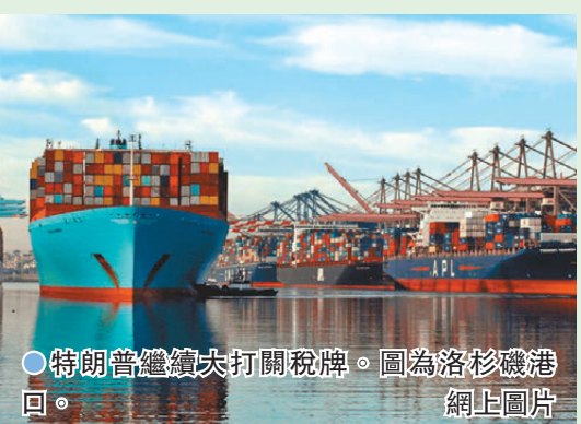
●特朗普繼續大開關稅牌。圖為洛杉磯港網上圖片

特朗普稱，美國經濟為世界帶來增長和繁榮，同時卻向美國人課稅，認為有需要作出改變，讓透過美國來賺錢的外國支付「公平份額」。特朗普並未說明ERS的具體運作方式，也沒有提到ERS是否會取代海關與邊境保護局(CBP)徵收關稅，又或取代美國國稅局(IRS)，向在美國經營活動的外國企業和個人徵收所得稅。《紐約郵