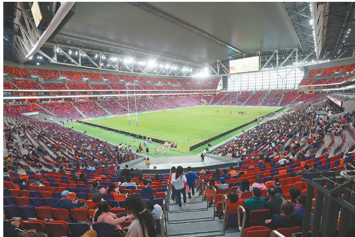
●啟德體育園主場館1月5日曾首辦測試賽，舉辦大專欖球賽。

「港鐵會在入場和散場時段，將屯馬線列車班次由平時5至6分鐘一班，加密至3至4分鐘一班。換言之，雙向每小時增加10至12班列車，相信足以應付演唱會帶來的額外乘客需求。」運輸署首席運輸主任（市區）尹柏恩呼籲市民使用港鐵，讓港鐵熟習如何配合體育園大型活動的車務安排。宋皇臺站的的士上落客區亦會加強服務。 警方表示，當日離場時間正值晚飯時間，相信部